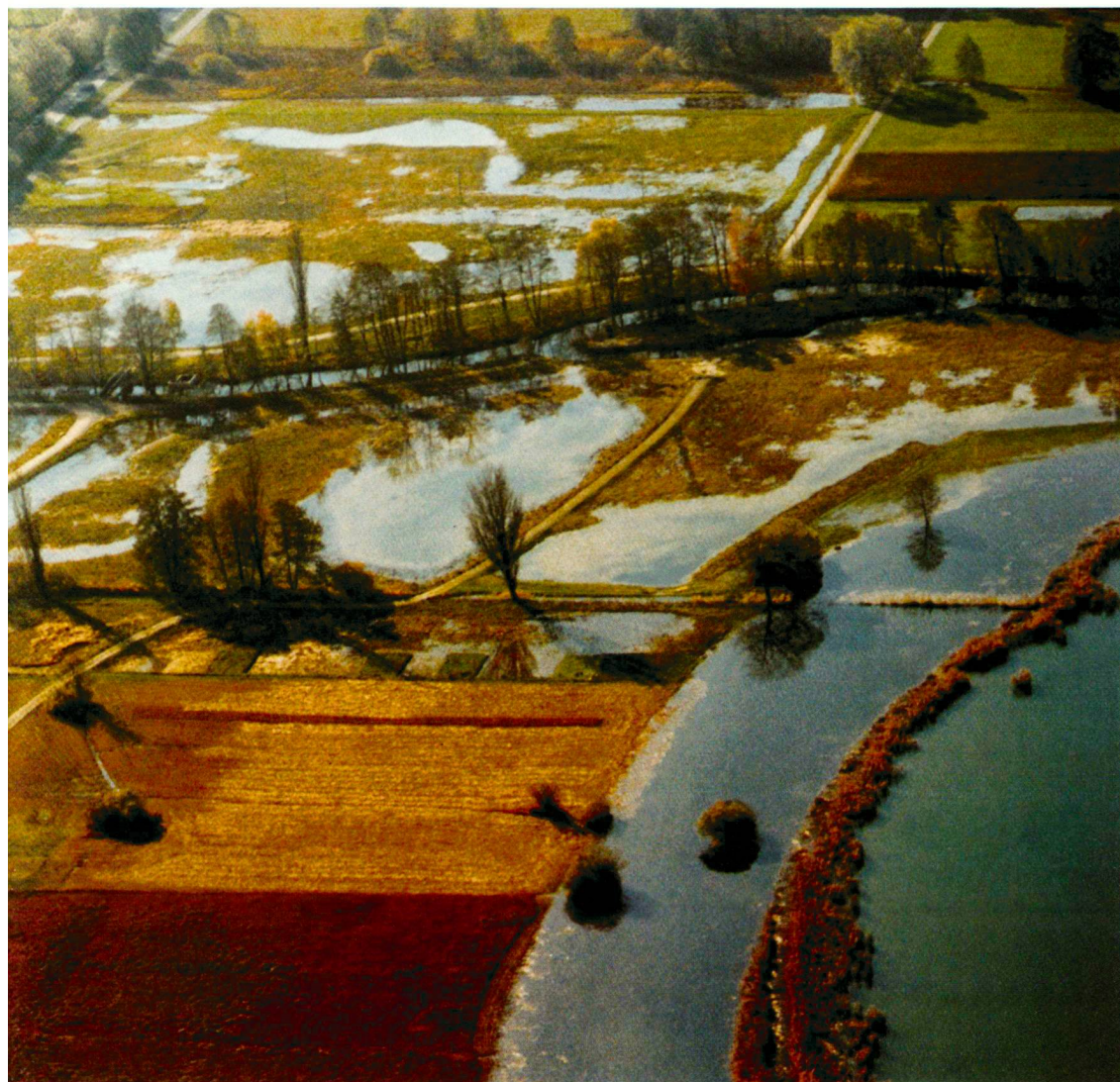
Luftaufnahme von Nordost- bei Hochwasser, 1998

Photo aérienne depuis le nord-est pendant une crue en 1998