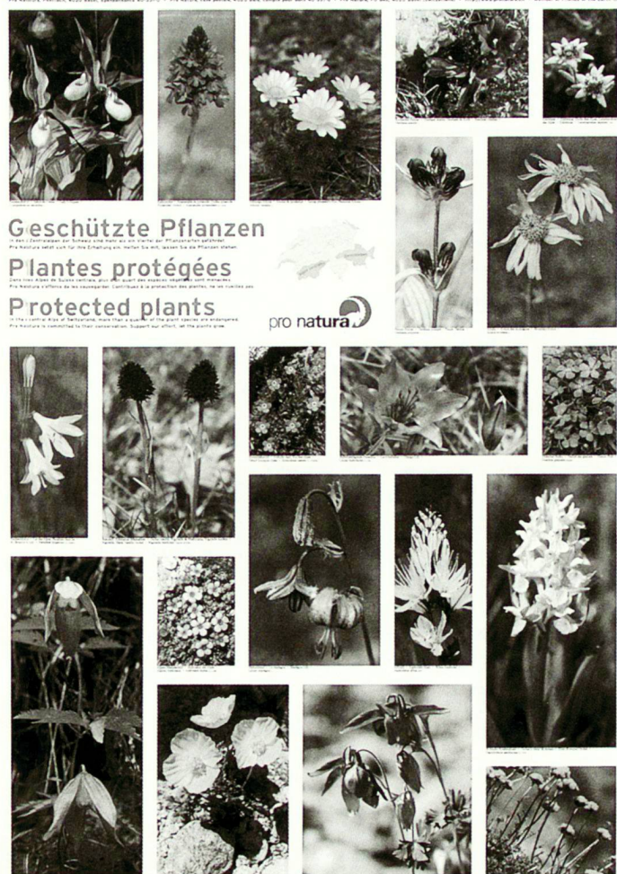
Pro Natura, Postfach, 4020 Bâle, Switzerland 40 2020 - Pro Natura, case postale, 4020 Bâle, Suisse pour 40 2020 - Pro Natura, PO Box, 4020 Bâle, Switzerland - 061/3179266 - Member of Friends of the Earth -

Informationen: Bergwaldprojekt, Rigastrasse 14, 7000 Chur,