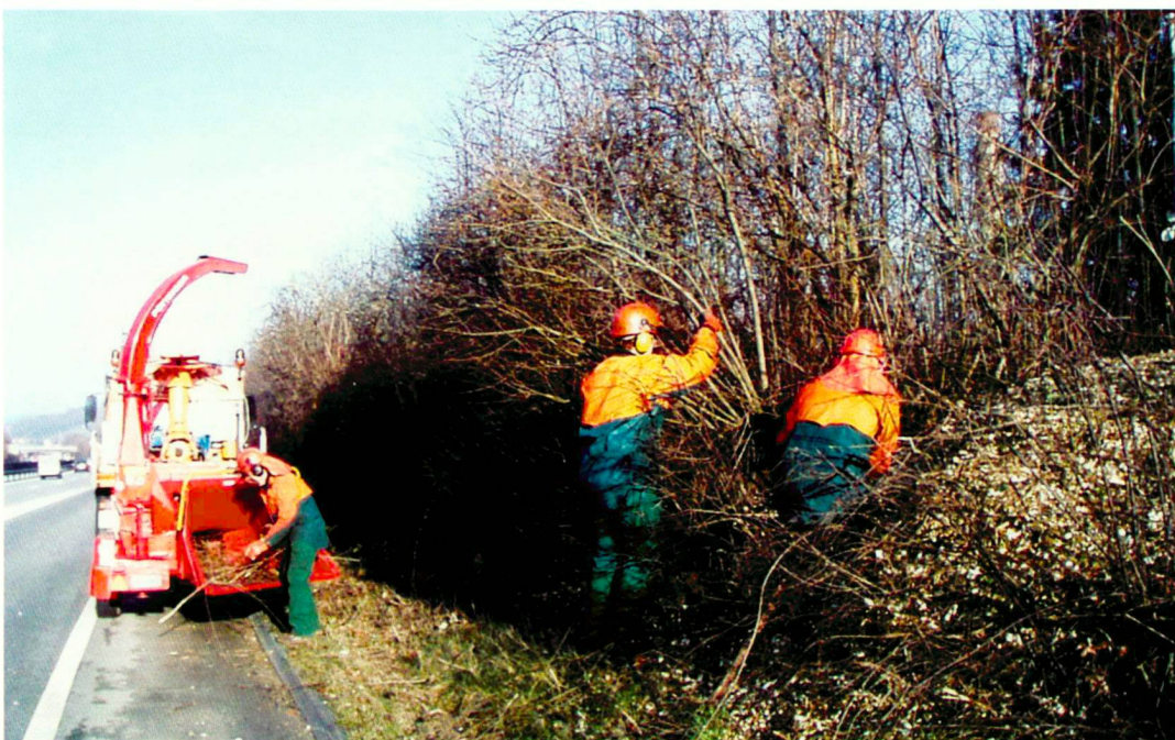
Pflegeequipe beim Gehölzschnitt

La planification des délais est un outil central de la gestion des espaces verts. À l'aide de la planification des délais, les moyens nécessaires à l'exploita-