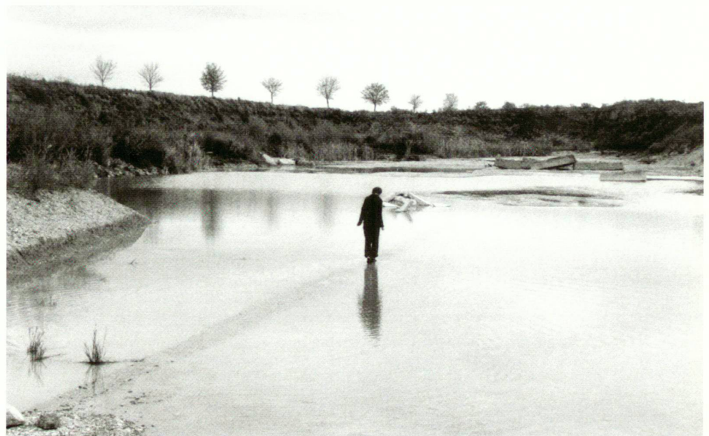
Workshop zum Thema Grenzen mit Thea und Jürg Altherr

– Die schwimmende Insel: Ein geflochtener Weidenring, gefüllt mit den weiss schimmernden