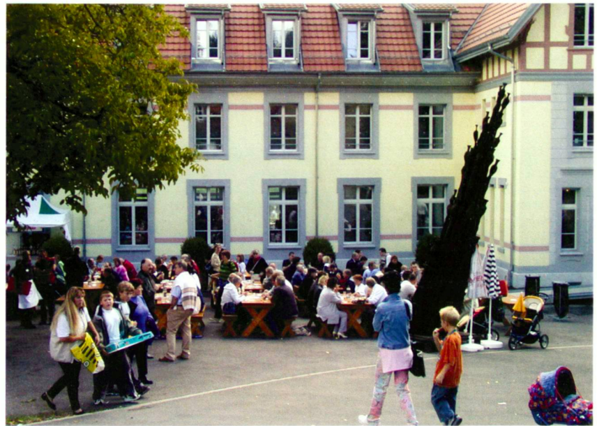
Klinik Südhang (2)