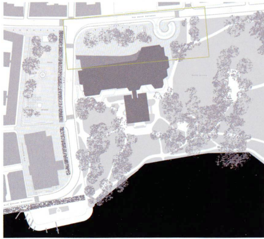
1 Paolo Bürgi (4)