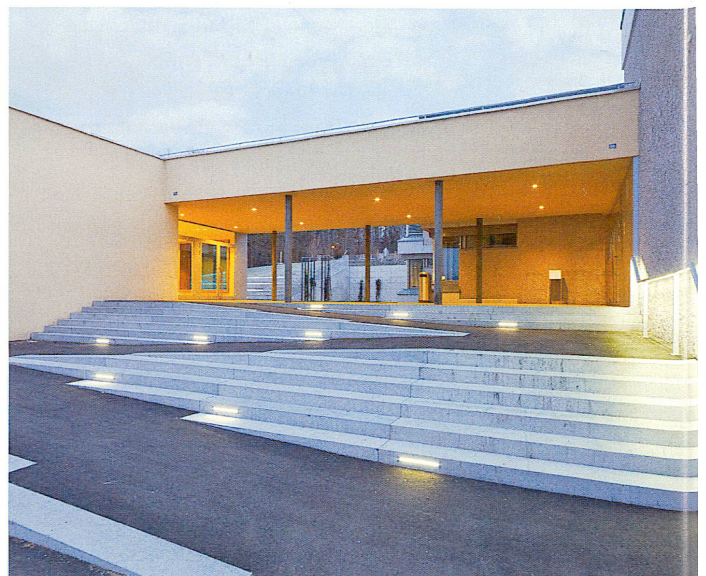
Zeljko Gataric Fotografie