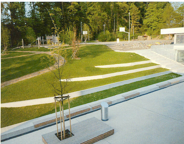
raderschall partner ag landschaftsarchitekten bsia sia

Die campusartige Abfolge von Plätzen, Wegen und Durchgängen wurde für die Aussenanlagen auch beim Erweiterungsbau des Schulhauses Nägeli-moos wieder aufgenommen. Umgebungsgestaltung (raderschallpartner ag landschaftsarchitekten bsia, Meilen)