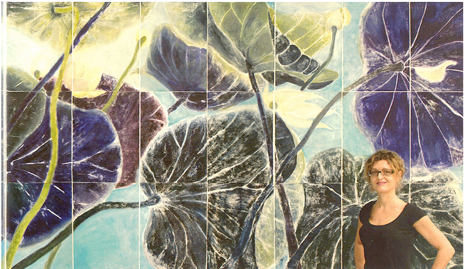
Bernadette Gruber: «light and rustling in a lotus pond», 230 x 500 cm, 27-teilig, auf Rives BFK 280 gsm, Carborundum, 2007 in Saigon, Vietnam. im Druck-Atelier der Künstlerin alpha Gallery erstellt.

Du 10 au 12 octobre 2011 ont eu lieu les 5èmes Assises Européennes du Paysage, intitulées cette année: «Le paysage – créateur de richesses» (voir anthos 3/2011, p...). Analyser cette création de richesses par le paysage, identifier ces actions et ces dynamiques, tel était le but que s'était fixé la manifestation. Les rencontres se sont tenues à Strasbourg, au Palais de l'Europe, magnifique cadre pour ces conférences et débats animés. La traduction simultanée en anglais, français et allemand de toutes les contributions a permis la participation de professionnels non francophones aux Assises, et ainsi un échange au-delà des frontières.