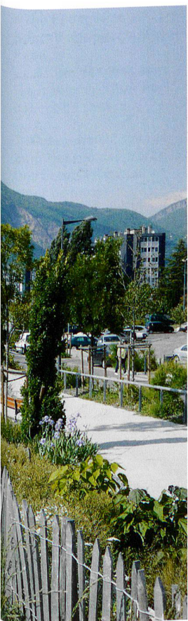
ADP Dubois (8)

2 Der Park Ouagadougou inszeniert die Nutzung und Abführung des Regenwassers. Le parc Ouagadougou met en scène la gestion écologique des eaux pluviales.