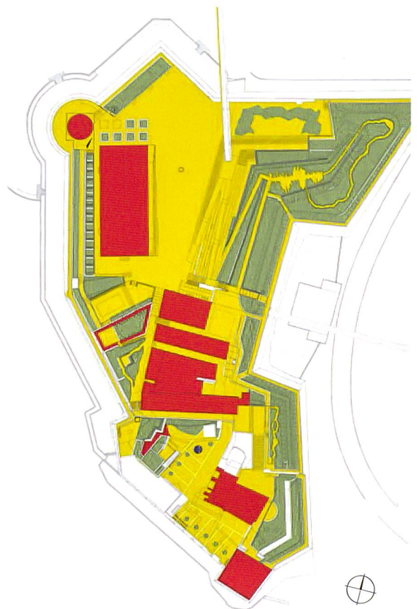
Bauwerke und Freiräume des Fort Saint-Jean Les bâtiments et les espaces du fort

Tandis que «le chemin des aromatiques», «le potager méditerranéen» et «le parcours ethnobotanique des plantes emblématiques de la Méditerranée» sont des jardins de collection aux plantes étiquetées et expliquées, notamment concernant les utilisations traditionnelles des plantes dans les cultures musulmanes et judéo-chrétiennes, «les jardins de la colline» ou «le bosquet des chênes verts» évoquent divers