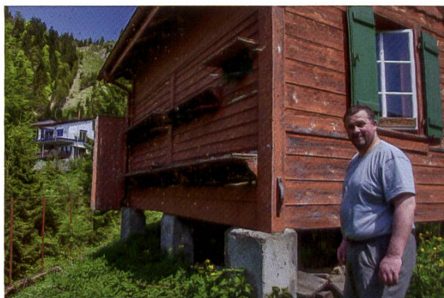
Rucher du monastère

La colonie a construit un rayon à mâles sans cire gaufrée sur toute la surface du cadre de