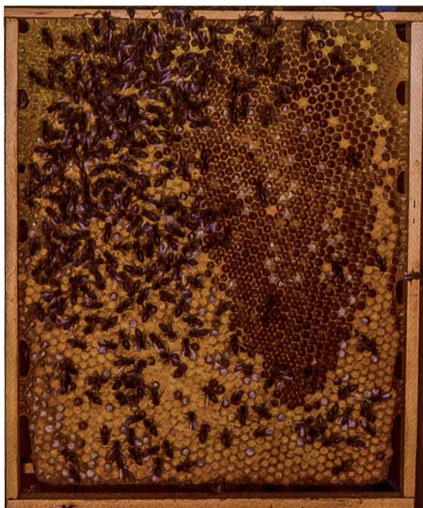
Cadre à mâles

la ruche suisse. Sur des feuilles de cire gaufrée du commerce, les cellules hexagonales se présentent généralement avec à chaque fois une pointe orientée vers le haut et une autre vers le bas. Dans le livre «L'apiculture – une fascination», il est écrit que dans le cas de constructions naturelles on y trouve à peu près autant de cellules verticales qu'horizontales. Sur le cadre illustré, les abeilles ont construit les cellules légèrement de biais. Etant donné que la plupart d'entre nous travaillent avec des cadres de cire gaufrée, cette image nous est inhabituelle.