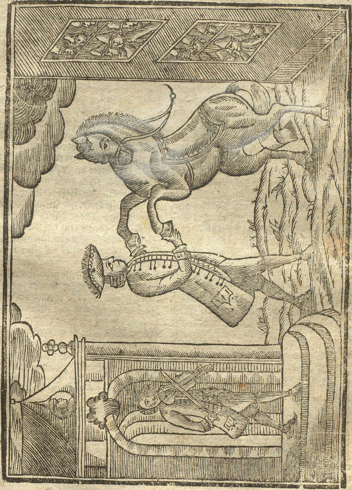
Abschilderung eines wohl abgerichteten Tanz-Pferdes.