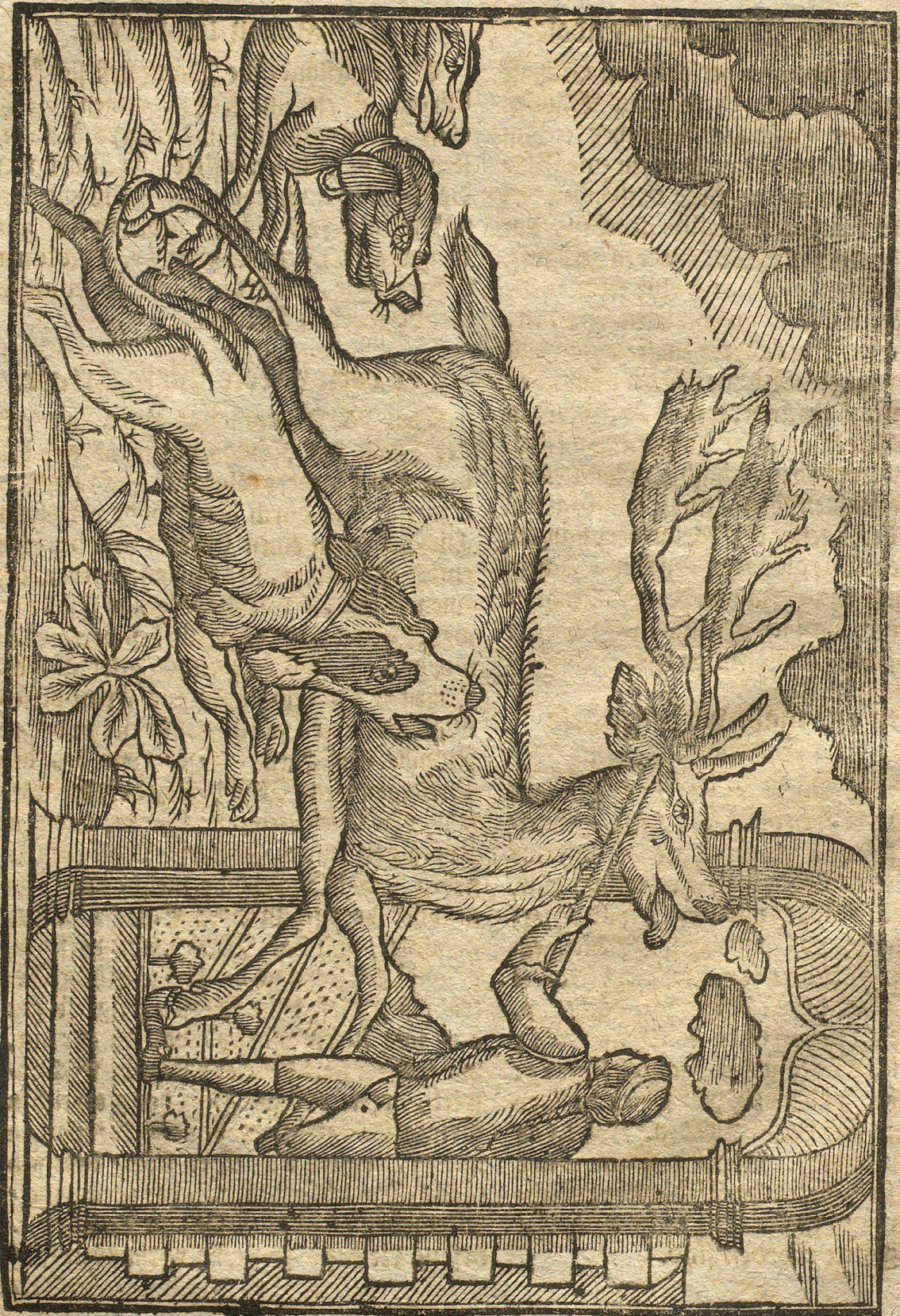
Besetzung des verführerischen Meisgarthers.