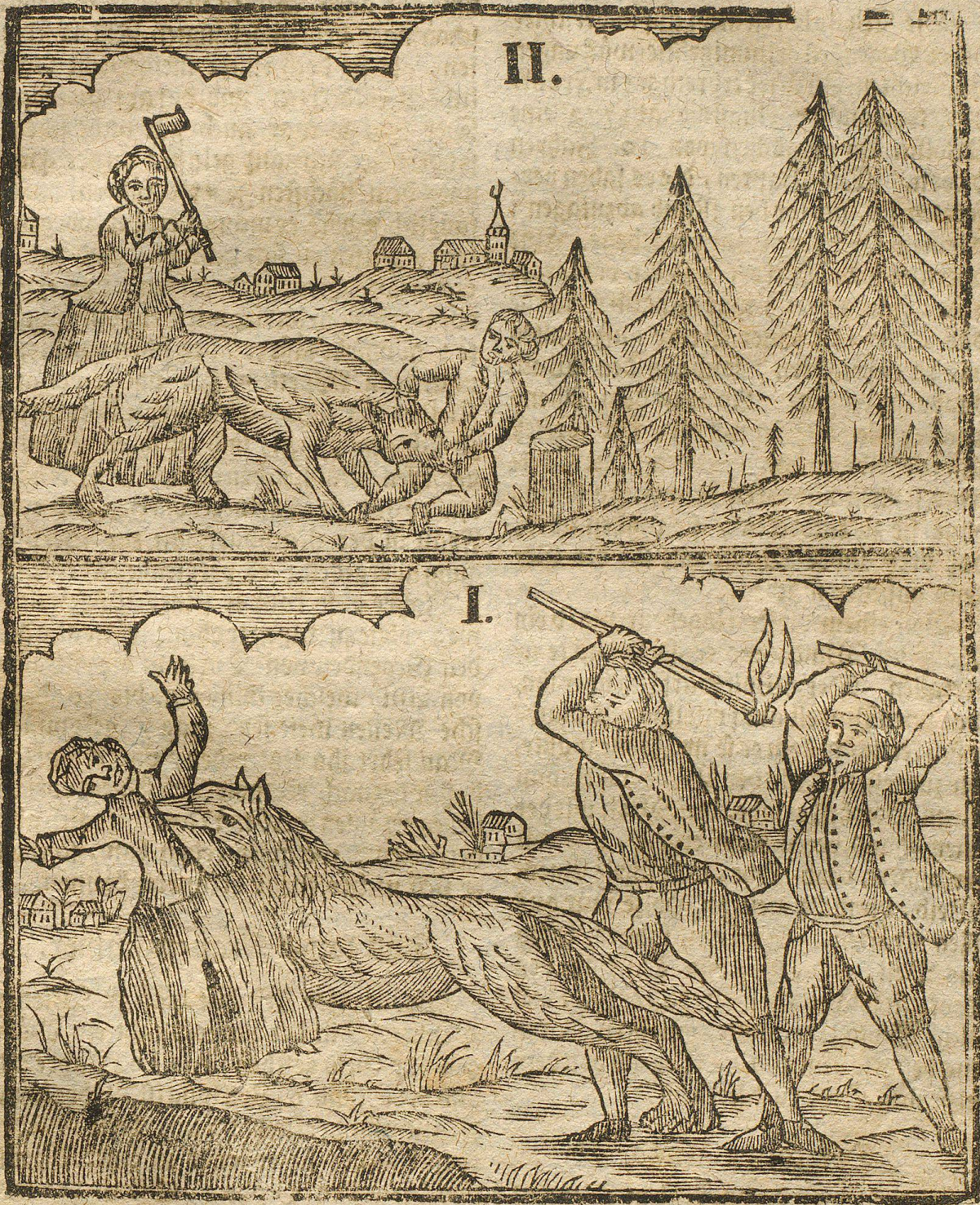
I. Wie die Wölfin ein Mägdechen von 10. Jahren darvon trug. II. Wie der Wolf einen Bauern im Wald angreiffen.