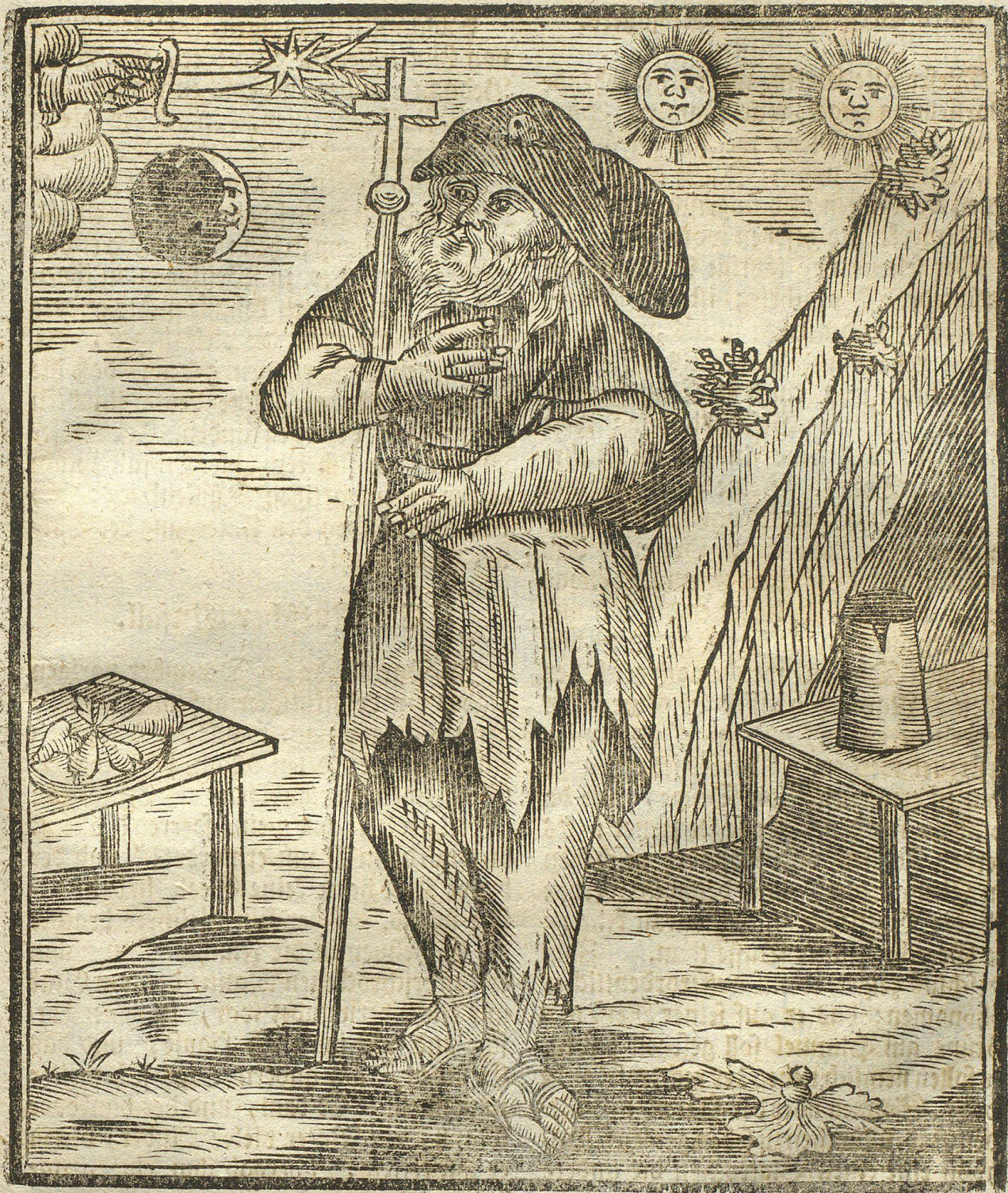
Vorstellung eines 120 jährigen alten Weisfagers.