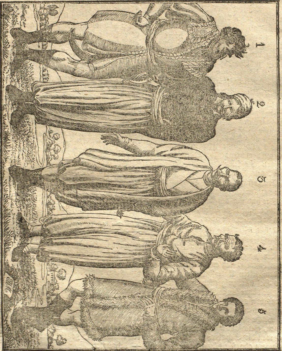
Abbildung einiger Stiefelringe aus Griechenland.