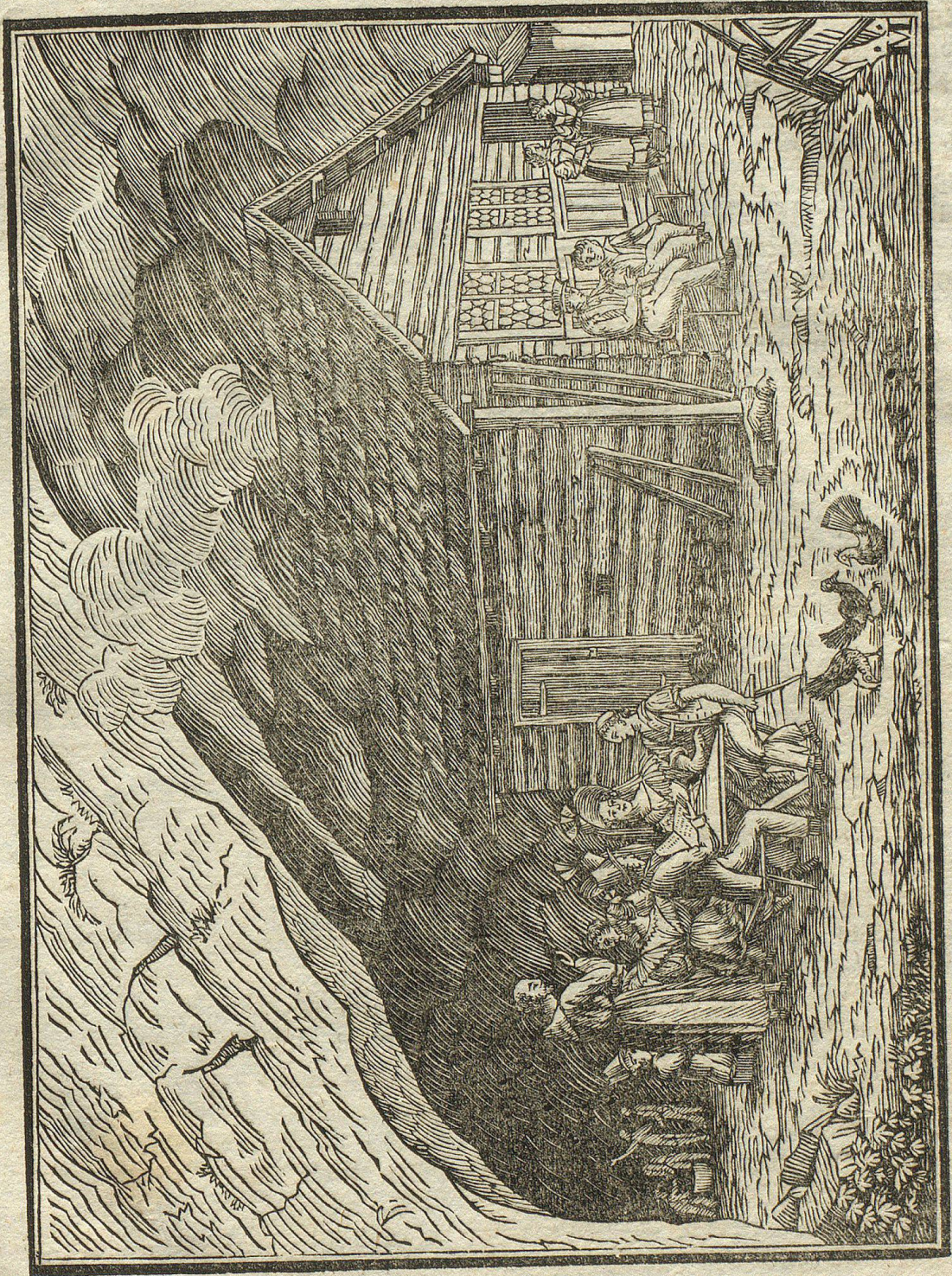
Die Einsiedler beim Wildfischlein, im Kanton Appenzell Inner- u. Rhoden.