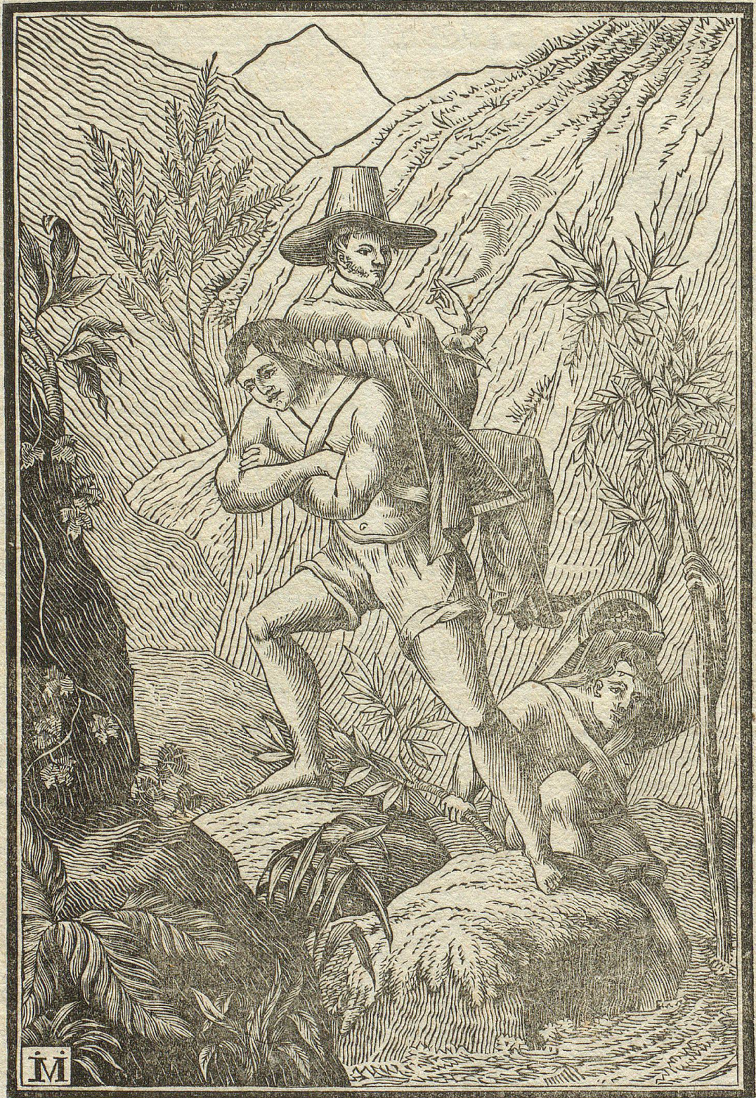
Die Art zu reisen in den südamerikanischen Gebirgen.