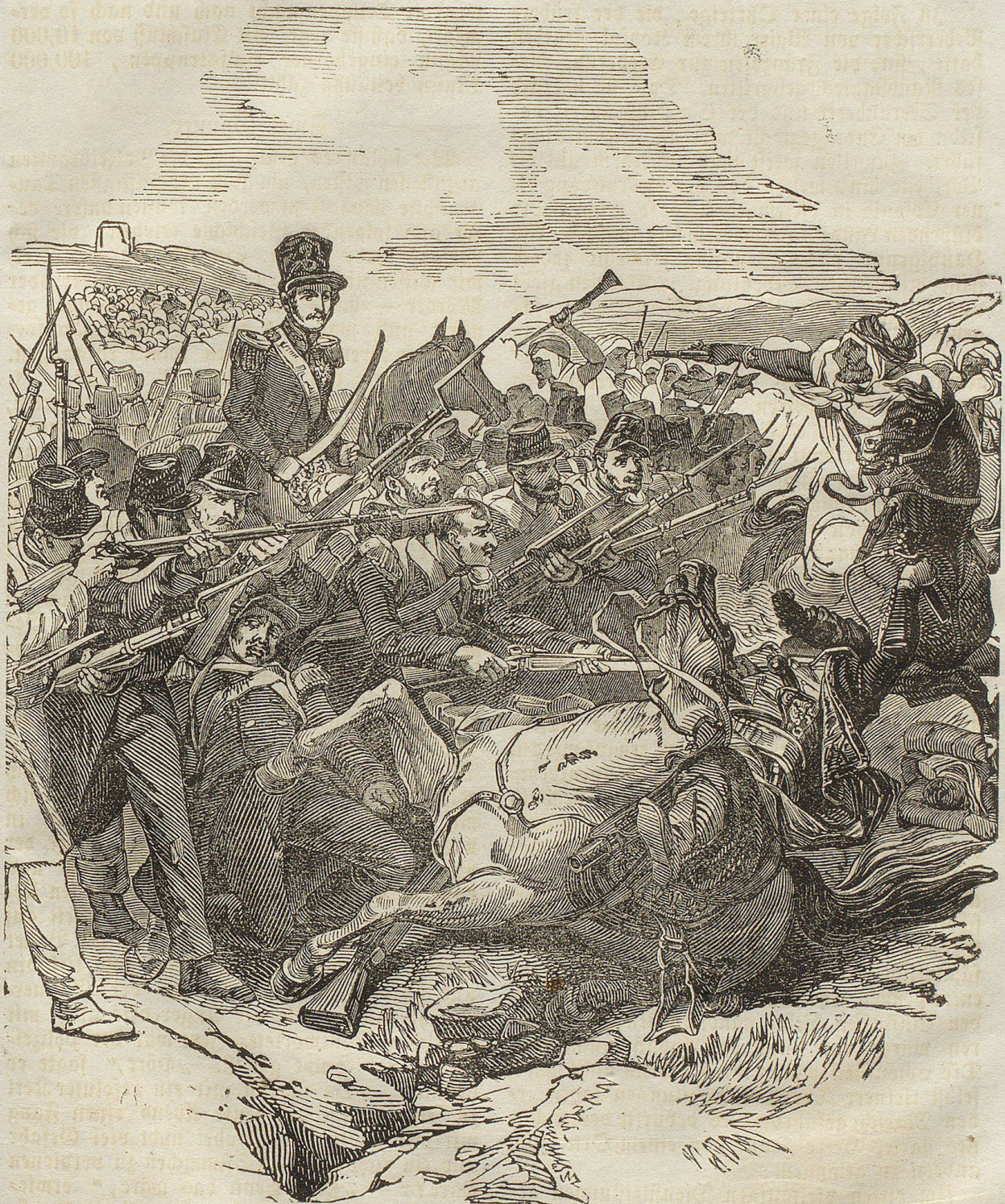
Gefecht mit Arabern in Algerien.