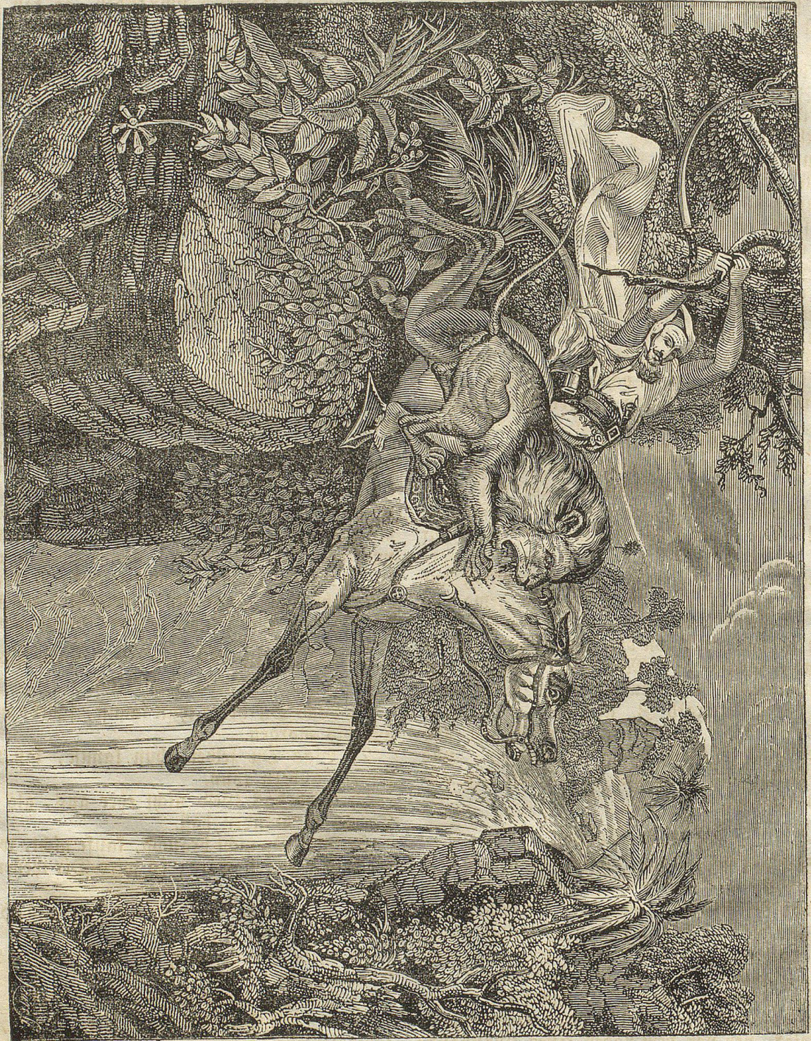
Der Sturzfall des Löwen.