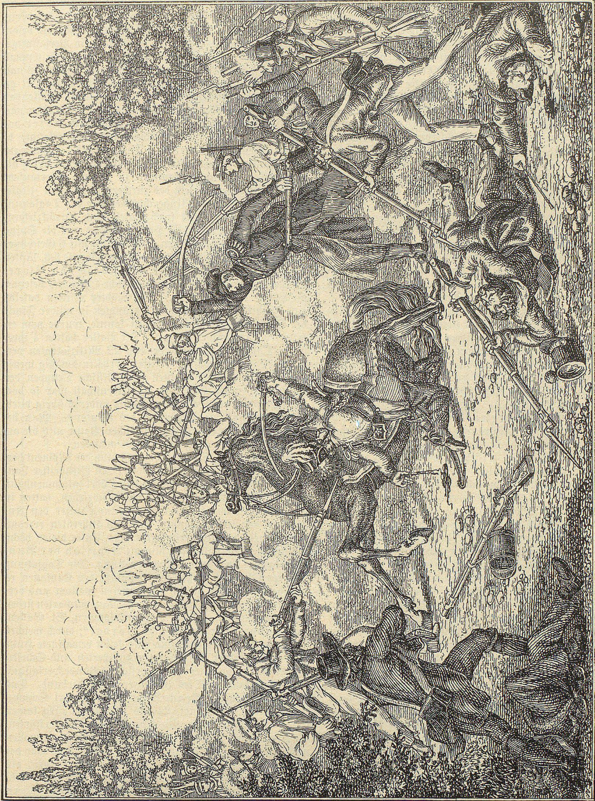
Niederlage der Basler in der Hardt den 3. August 1833. Zeichnung von Martin Disfeld.