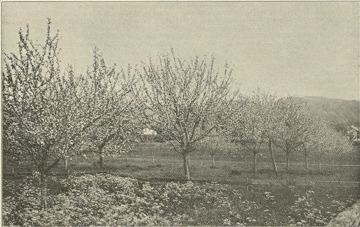
Apfelbäume in voller Blüte.

Verfahren der Baumbeschaffung nicht. Wer die Zeit des Suchens, Ausgrabens, Verpflanzens rechnet, das oft schlechte Wurzelwerk, den krummen Stamm, das häufige Absterben solcher Bäume in Betracht zieht, der kommt zum Schluß, daß sie nicht billig, wohl aber sehr teuer und dazu gering sind. Auch hat man dann im günstigsten Fall erst einen wilden Baum, der noch veredelt werden muß und dieses