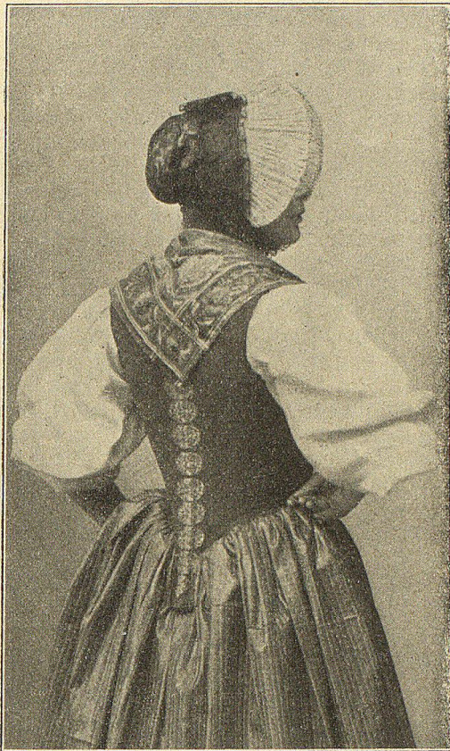
Rückenansicht des Niders und der Touffette.

Es war Mode, die weiten Röcke derart aufzunehmen, daß man sie mit den Ellbogen festhielt, indem man sie an die Hüften andrückte. Die ebenfalls aufgebauschte, dunkelfarbig gemusterte Schürze wird von den mit roten, langen Lederhandschuhen versehenen Händen mitsamt dem Kirchenbuch gehalten. Das Buch war mit Silber beschlagen. Allgemein dürften die Hemdärmel zu zwei Puffen mit schwarzen Sammetbändern unterbunden worden sein. Vom Nieder ist hier wenig sichtbar.