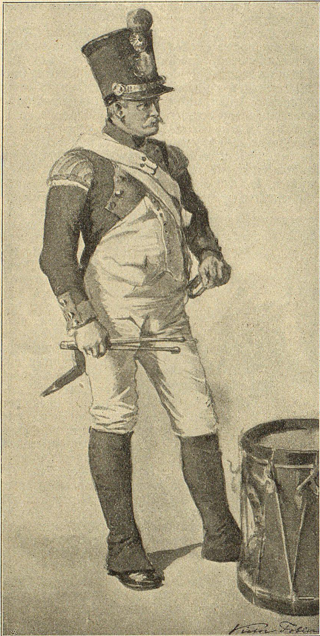
Appenzeller Tambour. Nach einem Aquarell von B. Tobler.

Zeitalter so arg verpönten Haselstock oder gar mit dem „Hagenschwanz“ bearbeiten ließ. Bei aller Strenge im Strafen hatte er jedoch immer nur die Besserung im Auge, und wenn diese sich einstellte, fand er sich zur ehrenvollen Rehabilitation der Betroffenen gern bereit. — Bestechlichkeit, dieses Erbübel der Landvögte der alten Zeit, war ihm fremd, und wehe demjenigen, der sich erkühnt hatte, sich auf solche Art und Weise die Gunst des Landvogts erwerben zu wollen. Deshalb wies er auch alle Geschenke beharrlich ab. Als ihm kurz nach dem Aufzuge in Greifensee ein Untervogt durch seine Frau ein Kalbsviertel aufs Schloß schickte, ließ er derselben eine Flasche Wein bringen