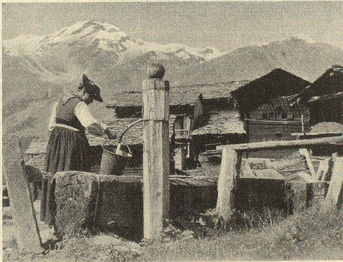
Dorfbrunnen in Forclaz (Val d'Horens).

Um das Wallis richtig verstehen und kennen zu lernen, muß man seine vielen Täler durchwandern, seine Berge besteigen, muß in alten, vergilbten Blättern forschen, muß Einkehr halten beim Walliser, seinen Erzählungen lauschen und zu verstehen suchen in Sprache, Geschichte und Sitte, was ihn erfüllt. So nur können wir ihn auch lieben, den wahren, unverfälschten Volkstyp, der in vielen Dingen sich gleich geblieben ist, seit Jahrhunderten.