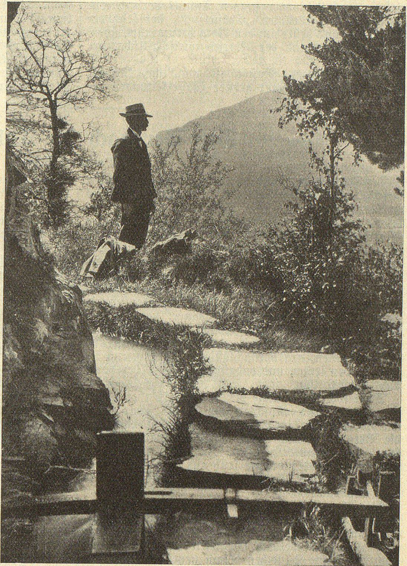
Der Wasserchlegel am Neuwerk.

Die Wasserleitungen selbst sind im allgemeinen Eigentum von GEMEINSCHAFTEN. So hat jeder Genosse abwechselungsweise das Benutzungsrecht. So ein „Chehr“ dauert durchschnittlich drei Wochen und zwar wird das Anrecht jedes Genossen auf eine Tefle eingekauft. Diese Teflen sind Hölzer, auf welchen auf einer Seite das Hauszeichen des Berechtigten, auf der andern die Größe der Berechtigung eingekauft ist. Aber nicht nur das Nehmen, auch das Geben wird auf Teflen vermerkt. So gilt ein ganzer Querschnitt als Leistung für 50 Rappen. Für einen guten Arbeiter werden 6 Striche gemacht, für einen mittleren 5, für einen schwächeren 4, für ein