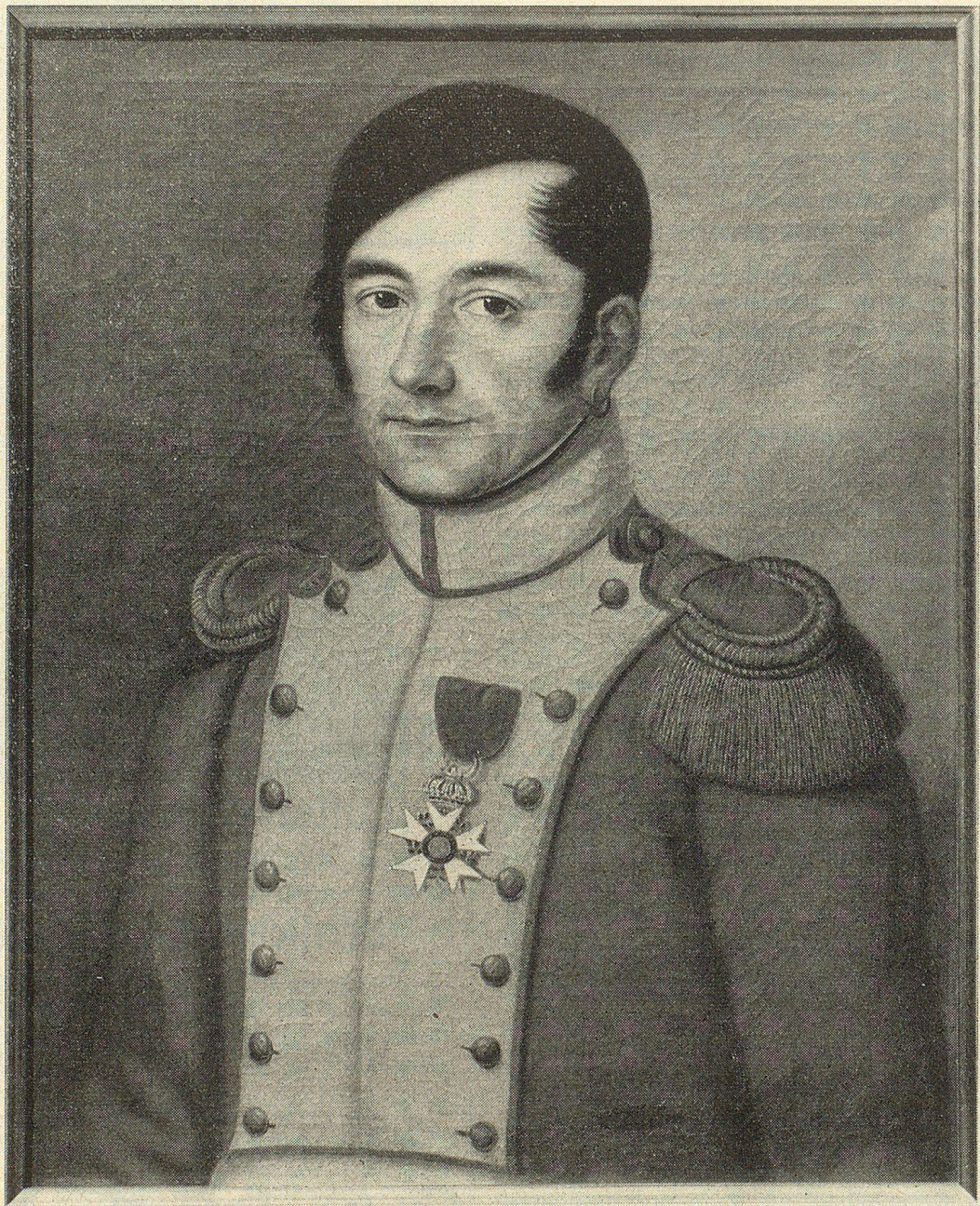
Thomas Legler, der Sänger an der Beresina 1782—1835