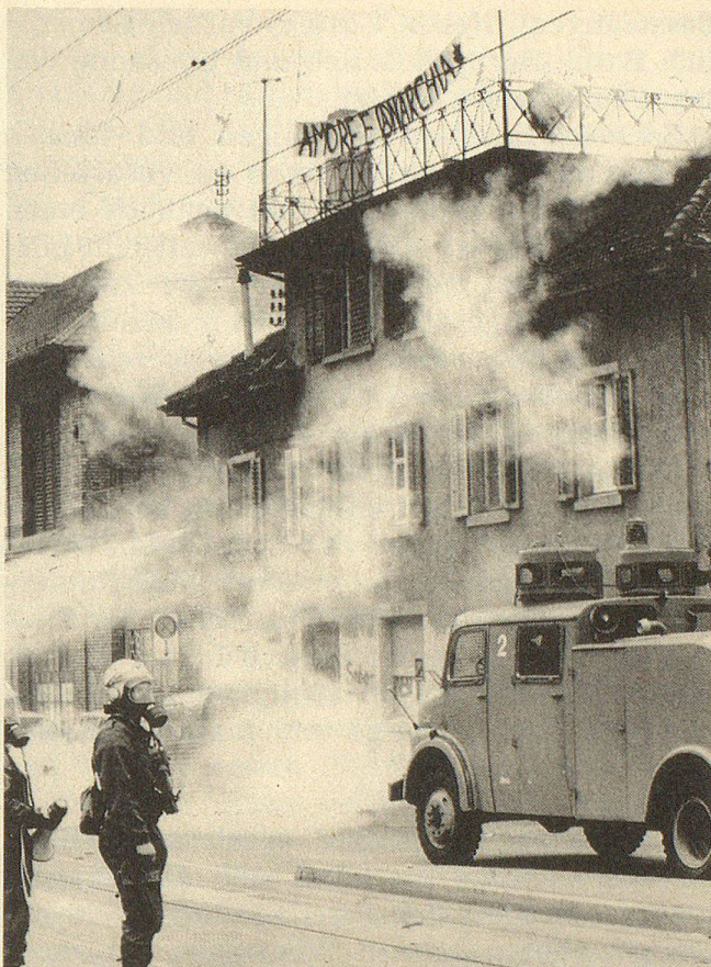
Jugendunruhen in verschiedenen Schweizer Städten — Krankheitssymptom unserer Wohlstandsgesellschaft?

Selten genug beschäftigen sich die ausländischen Medien mit der Schweiz — zu unspektakulär sind hierzulande üblicherweise die politischen Vorgänge, zu unbedeutend wohl auch unsere Probleme, gemessen an weltweiten Massstäben. Wenn dies in der Berichtsperiode dennoch einigermaßen oft geschah, so hatte das seinen ganz besonderen Grund: Verschiedene Schweizer Städte wurden von Jugendunruhen erschüttert, und für einmal gab es für ein tiefgreifendes gesellschaftliches Phänomen kaum auswärtige Vorbilder. «Macht aus dem Staat Gurkensalat!», hiess das Motto einer «Bewegung», deren Exponenten mindestens teilweise vor Gewalt und Ausschreitungen nicht zurückscheuten. So unfassbar der Jugendprotest im einzelnen erschien, so lief er letzten Endes auf eine neue und spektakuläre Form der Zivilisationsverweigerung hinaus. Hierin unterschied sich die Jugendrevolte von 1980/81 grundlegend von der 68er-Bewegung, die klar umrissenen politischen Leitbildern (Ho Chi Minh, Mao, Che Guevara) gefolgt war.