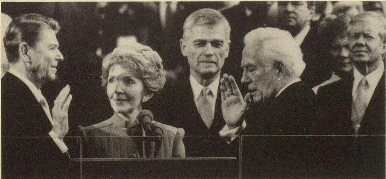
An der amerikanischen Staatsspitze löste der Republikaner Ronald Reagan (links) den seit vier Jahren amtierenden Präsidenten Jimmy Carter (Hintergrund rechts) ab.

Blieb die sowjetische Aussenpolitik im wesentlichen geradlinig, so gab es auf amerikanischer Seite eine tiefgreifende Tendenzwende zu beobachten: Seit dem Amtsantritt der Administration Reagan sind unmissverständliche Signale ausgestrahlt worden, das Hegemonialstreben der östlichen Supermacht nicht länger widerstandslos hinzunehmen. Reagans Wahlsieg entsprang zweifellos zu einem nicht geringen Teil der Unsicherheit über die Rolle der USA in der Welt, welche die Präsidentschaft Jimmy Carters vermittelt hatte.