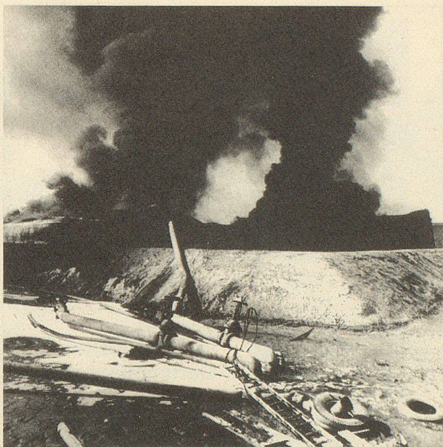
Der Golfkrieg zwischen Iran und Irak beschwor für kurze Zeit die Gefahr einer globalen Erdöl-Versorgungskrise herauf.

Die relative Machtlosigkeit der Supermächte USA und UdSSR erwies sich auch beim Ausbruch des Krieges zwischen Iran und Irak , der in seiner Anfangsphase die gesamte Golfregion in Brand zu stecken drohte. Monatelang schleppte sich der Konflikt dahin — unberechenbar sowohl für den Westen als auch für die Sowjetunion. Selbst die Konferenz Islamischer Staaten und die Sozialistische Internationale erzielten angesichts der unnachgiebigen Forderung der Iraner nach vorgängigem vollständigem Truppenrückzug der Iraker keinen Durchbruch. Irak hatte das von inneren Auseinandersetzungen erschütterte Nachbarland am 22. September 1980 angegriffen, um erstens die volle Souveränität über den Schatt-el-Arab, den gemeinsamen Unterlauf von Euphrat und Tigris, zurückzuerlangen, zweitens die iranische Provinz Khusistan mit ihrer arabischstämmigen Bevölkerungsmehrheit zu befreien und drittens dem Ayatollah-Regime in Teheran, das seit dem Sturz des Schahs ununterbrochen die irakischen Schiiten gegen die (sunnitische) Baath-Herrschaft in Bagdad aufgewiegelt hatte, einen Denkwort zu verpassen. Diese Kriegsziele hatten die Iraker mit Leichtigkeit zu erreichen gehofft; aus den Trümmern der arg