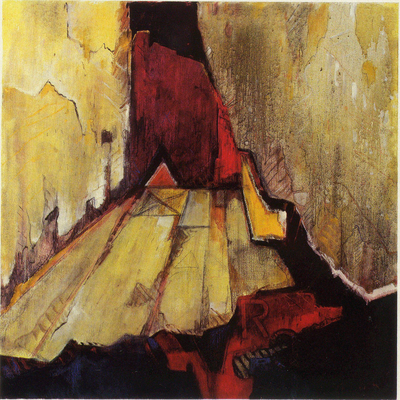
«Raumbild», Öl auf Leinwand, 1978, 100×100 cm