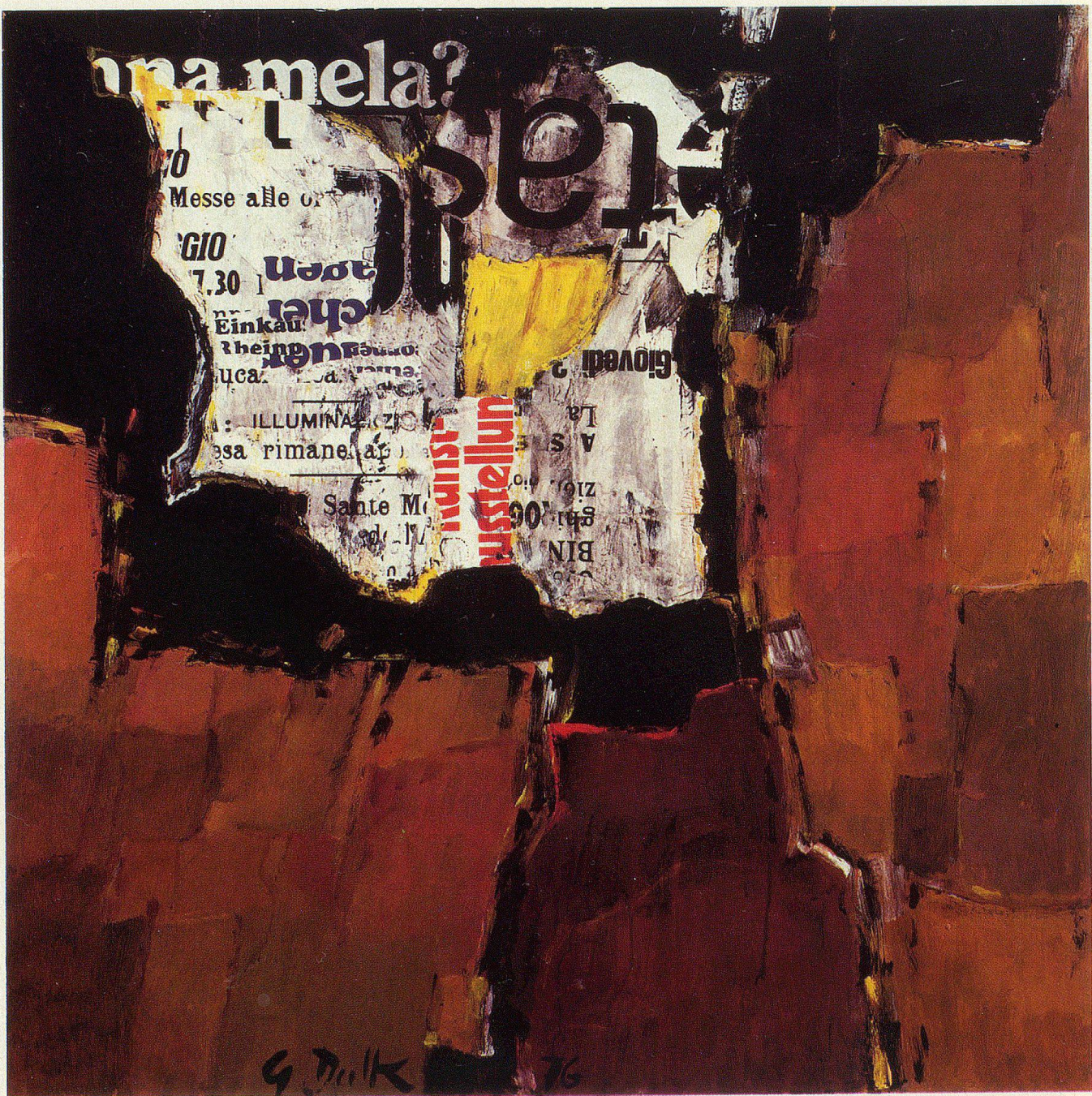
«una mela», Mischtechnik, ca. 1976, 100×100 cm