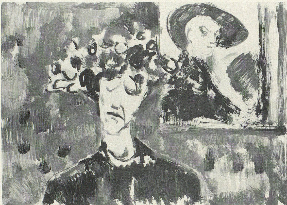
«Alte Dame» Gouache ca. 1960 70×50 cm