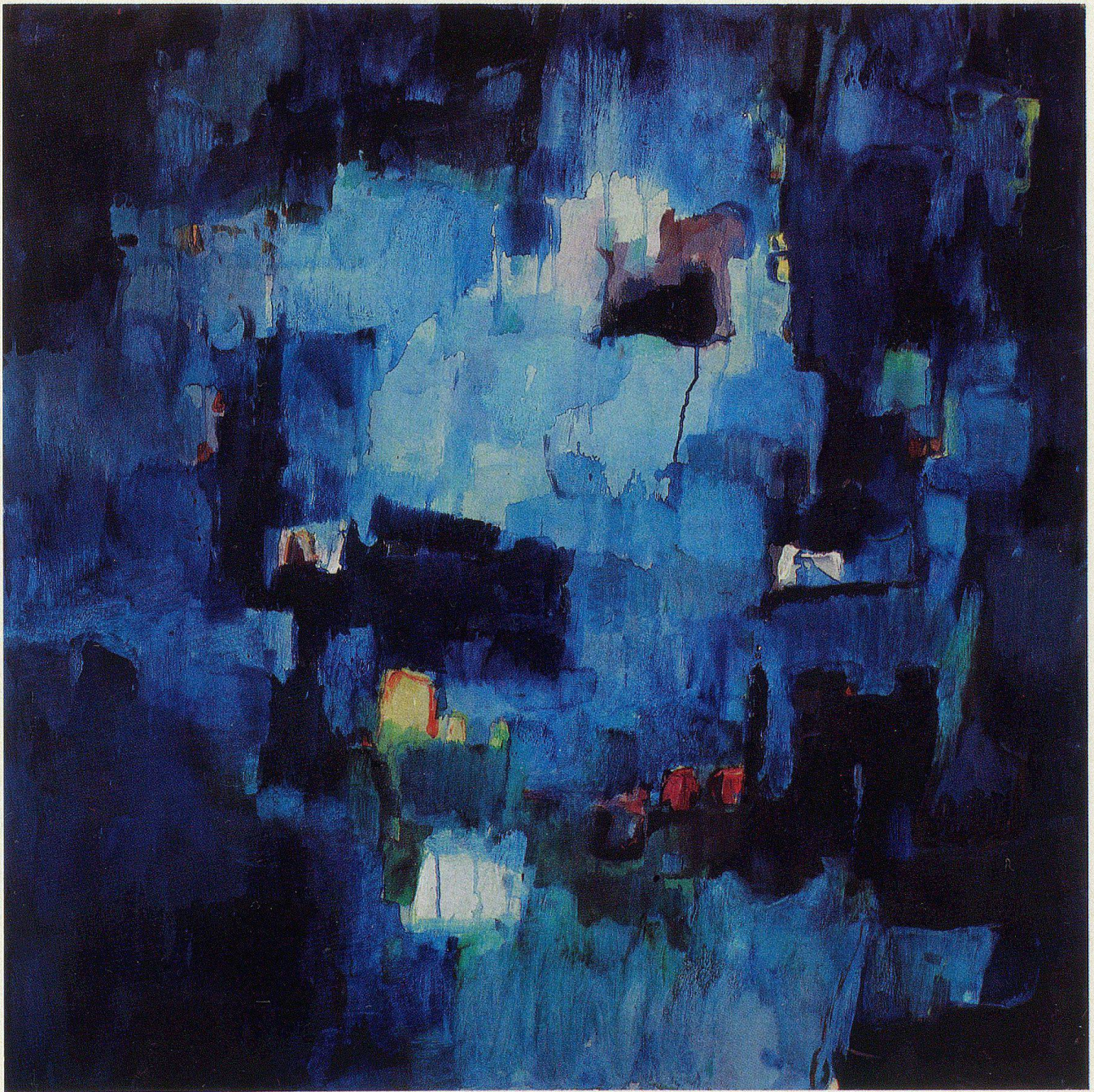
«Blau», Öl auf Leinwand, ca. 1970, 80×80 cm