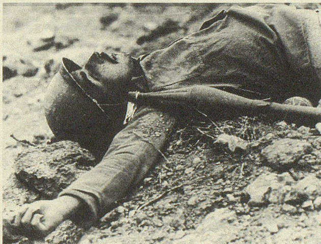
Einer von mehreren zehntausend iranischen Soldaten, die bei der Grossoffensive in den süd-irakischen Hawitah-Sümpfen Mitte März den Tod fanden.

Auch im Nahen und Mittleren Osten gab es wenig Anlass zu Optimismus. Vermittlungsbemühungen im Golfkrieg scheiterten ein übers andere Mal an der unbeugsamen Haltung des Khomeiny-Regimes, das auf der Absetzung und Bestrafung des irakischen Staatschefs Saddam Hussein bestand. Während die Iraker mit Luftangriffen gegen Tanker und Handelsschiffe im Golf die Wirtschaftskraft Persiens zu schwächen trachteten, suchten die Iraner die Entscheidung auf dem Schlachtfeld: Im März 1985 brach eine weitere Grossoffensive im konzentrierten Abwehrfeuer der Iraker zusammen; gegen 80 000 Soldaten sollen in den Hawizah-Sümpfen im Süden Iraks umgekommen sein.