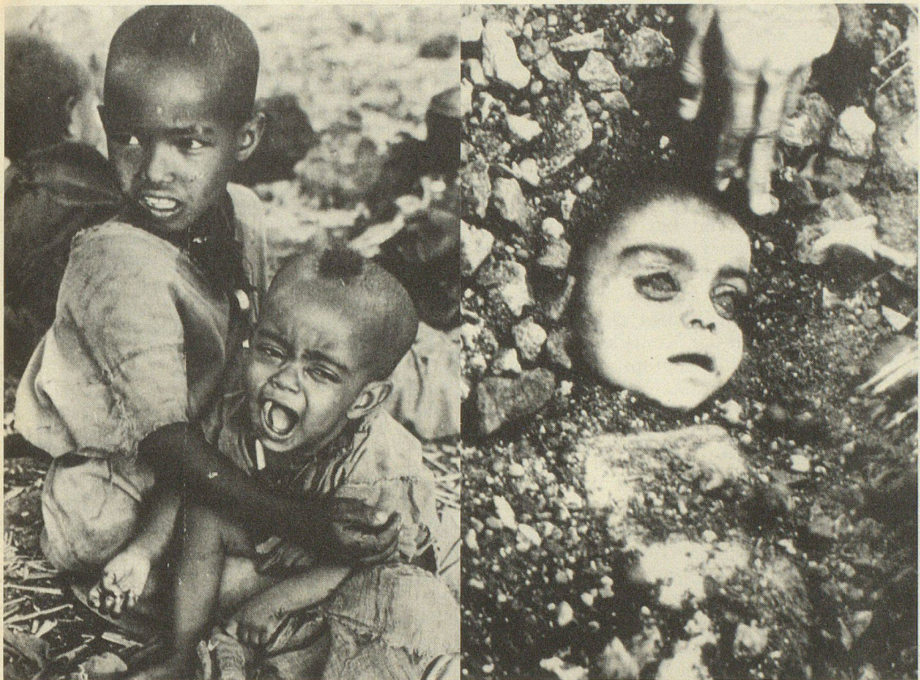
Vom Hunger bedrohte äthiopische Kinder in einem Flüchtlingslager — Ein Opfer der Giftgaskatastrophe von Bhopal (bestes Pressebild des Jahres 1984).

an, die sich damit auf blutige Weise für die Erstürmung ihres Hauptheiligtums, des Goldenen Tempels von Amritsar , durch indische Streitkräfte rächten. An der Zuspitzung des Sikh-Konfliktes war Indira Gandhi nicht gänzlich unschuldig gewesen, hatte sie doch lange Zeit die Autonomiebestrebungen der Sikhs im Bundesstaat Punjab hintertrieben. Als schliesslich Extremisten unter Sant Jarnail Bhindranwale eine Bomben- und Terrorkampagne entfalteten, um ihren Forderungen nach einem unabhängigen Sikh-Staat «Khalistan» Nachdruck zu verleihen, wurde der Einsatz von Bundestruppen unausweichlich: Der Sturm auf den Goldenen Tempel von Amritsar , wo sich Bhindranwale und seine Anhänger verschanzt hatten, endete am 6. Juni