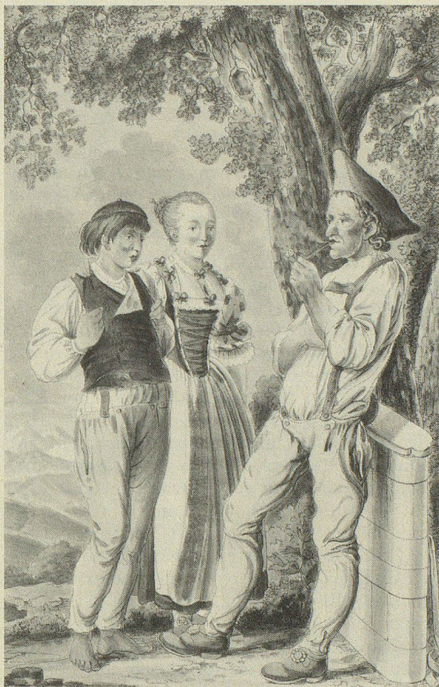
Tracht der Landleute in Innerroden, Canton Appenzell.

Die Männer tragen eine kurze Jacke, eine Weste, und lange bis dicht auf die Schuhe reichende Beinkleider, welche ein breiter Hosenträger in die Höhe hält. Ohne diesen würden die Appenzeller, wie wahre Ohnehosen dastehen, denn die Beinkleider sind so kurz, dass fast allen das Hemd hinten herab hängt. Man will versichern, dass das weit herabhängende Hemd bei vielen eine Kokerie sei, allein ich habe es bei Männern von solchem Alter und gesetztem Wesen bemerkt, dass dies wohl nicht der Fall seyn konnte. Da der Gurt nur bis in die Höhe des Schenkelkopfs steigt, so zieht sich das Hemd bei jeder beugenden Körperstellung nothwendig weiter hervor, und muss hernach herabhängen; wie wohl mir dies äusserst drollig vorkam, so musste ich noch mehr lachen, als ich in die grosse Wirthsstube trat. Die sitzenden Männer, welche ich von hinten sah, gaben mir einen zu sonderbaren Anblick. Ich traute anfänglich meinem Auge nicht, so unanständig schien mir diese Anzugssitte, wodurch bei Körperbeugungen, und besonders bei der sitzenden Stellung gewisse Theile dem Auge in ihrer ganzen Form, nur von dem dünnen Hemd bedeckt, recht sichtbar gemacht werden. Die Stube war voll Weiber und Mäd-