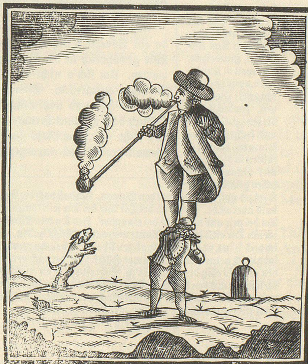
Der junge Samson

Legen wir den zweihundertjährigen Kalender mit seinen groben, verbräunten Seiten und den schwärzetricfenden Drucktypen ins Archiv der Geschichte zurück und machen wir einen Zeitsprung vorwärts ins Jahr 1890. Der Appenzeller Kalender für 1891 steht jetzt im 170. Jahrgang, erscheint bei Schläpfer in Trogen und hat dasselbe Erscheinungsbild wie heute noch. Relativ schmal wirkt die Publikation, mit einem grossen Unterhaltungsteil und nur wenigen Holzstichen, die sich auf's aktuelle Geschehen beziehen. Ruhig – und vielleicht etwas langweilig – gehen die Zeiten. Doch ist der Frieden auch hoch zu schätzen; der Kalendermann hat in seiner Weltumschau jedenfalls für Europa keine Kriege und welterschütternden Ereignisse zu