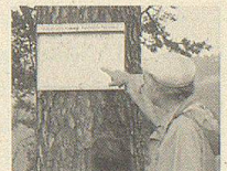
Erster Gesund- heitswanderweg