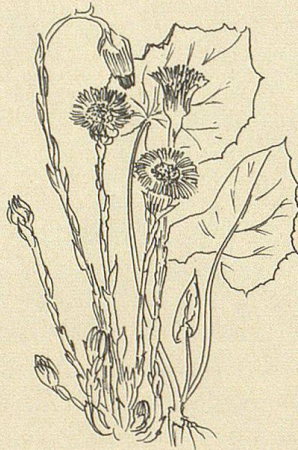
Entlang des Gesundheitswanderwegs sind alle Pflanzen auf Informationstafeln abgebildet und beschrieben.

stelle Scheidweg (Kaien 967 m über Meer).