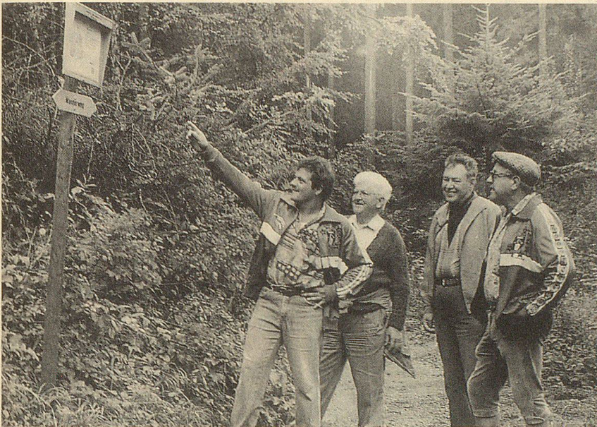
Die ideale Kombination «Lachen und Wandern» ist ein einmaliges Gesundheitsrezept für alt und jung, gross und klein.

Wandern ist gesund und Lachen ist bekanntlich die beste Medizin. Und wenn beides zusammenkommt, dann kann da höchstens den Ärzten das Lachen vergehen... Das entsprechende Gesundheitsrezept heisst Appenzeller Witzweg, der sich als neugeschaffene Wanderoute in kürzester Zeit zu den beliebtesten Pfaden der Schweiz gemauert hat.