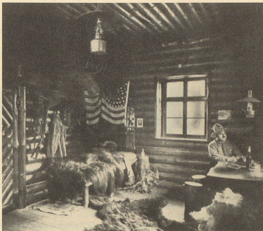
Das Innere eines Blockhauses, ausgestattet nach Wildwestmanier. Karl May liess es im Garten seiner Villa in Radebeul erstellen, um der Realität seiner Phantasie-Erzeugnisse näherzukommen.

Viele seiner Reiseerzählungen hat er geschrieben, ohne das Land persönlich besucht zu haben. Er schöpfte sein Wissen über Land und Leute aus der einschlägigen Literatur und besass bei seinem Tode eine Bibliothek von 3000 Bänden. Er hat aber in späteren Jahren die meisten Länder, über die er geschrieben hatte, dann doch noch besucht und dabei festgestellt, dass seine Schilderungen in den Büchern