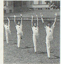
Stramme Turner vom Kollegium Appenzell