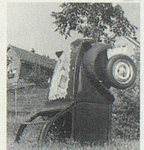
Originelles Denkmal in Reute AR