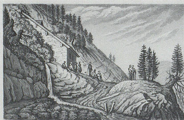
Die St. Jakobs-Kapelle am Kronberg. L'or Chapelle de St. Jacques près du Kronberg.

Die einst durch Geleitbriefe und Bescheinigungen legitimierten oder an speziellen Abzeichen erkennbaren Pilger genossen besonderen Rechtsschutz und hatten Anspruch auf die Werke der