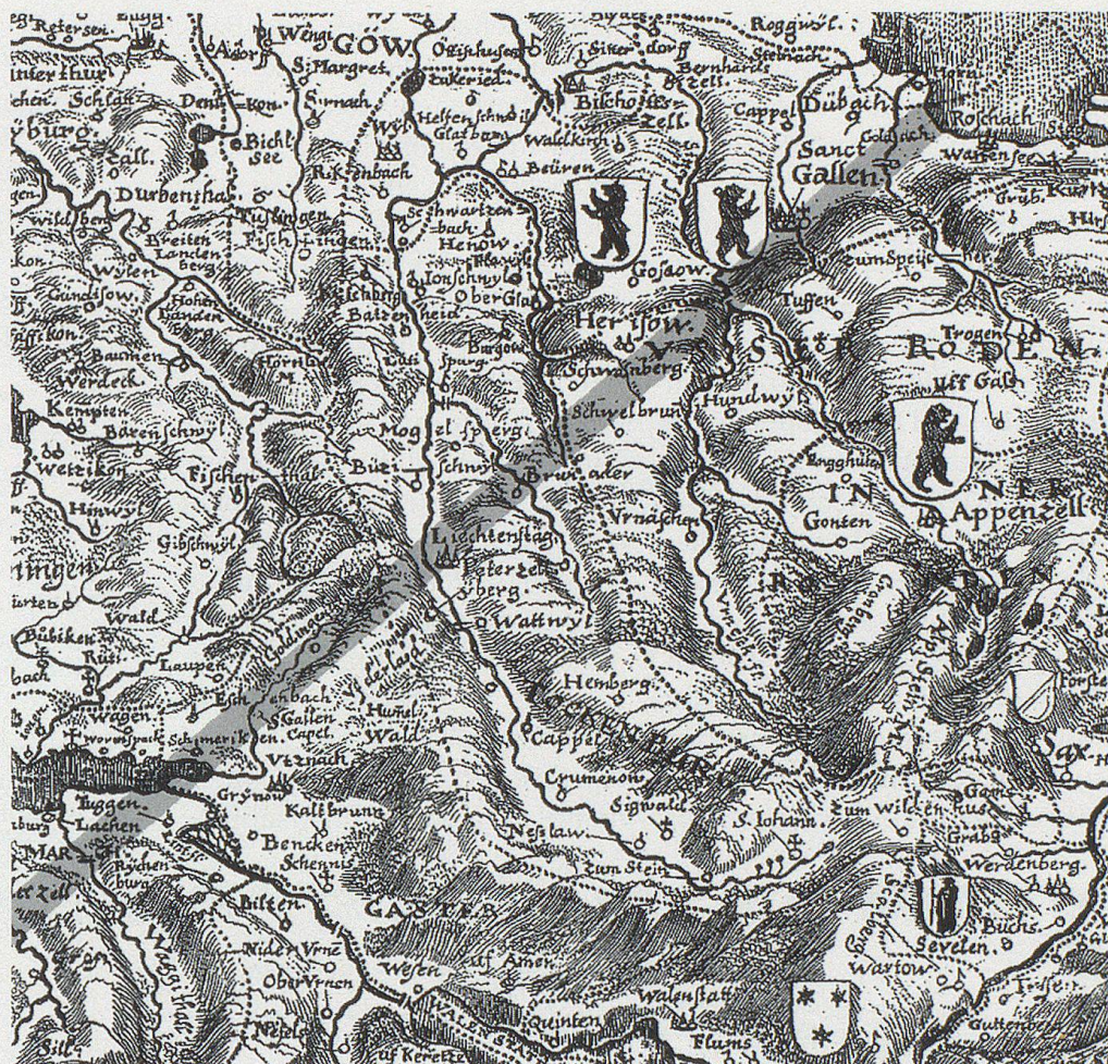
Orte am Jakobsweg zwischen Rorschach und Schmerikon auf dem Hintergrund der Schweizerkarte von Hans Conrad Gyger, 1657.

serfunktionen. Bis heute hat sich eine Vielfalt kleiner religiöser Wegbegleiter erhalten. Am Häufigsten begegnen uns Weg- und Flurkreuze oder Kruzifixe. Selten geworden sind Bildstöcke und Wegkapellen, die ein Heiligenbild oder eine Heiligenstatue bergen. Die über die Laad ziehenden Pilger lud auf der Heid ein Bildstöckli zum Gebet, beim «Bildhaus» in Ernetschwil grüßte die Reisenden ein grosses Engelsbild. Auch Flurnamen wie Pilgerrüti am Ricken erinnern an alte Verkehrswege.