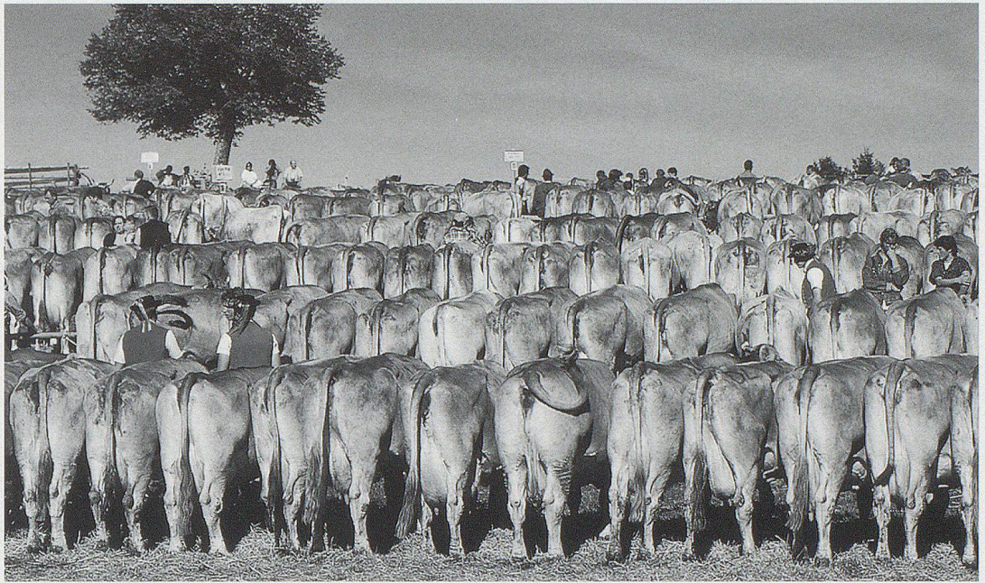
Appenzeller Viehschauen (hier in Schwellbrunn) bei schönstem Herbstwetter.

ten müde vor sich hin, es fehlte ihnen die Frische der Herbstnächte. Das Steinobst reifte schnell und konnte in guter Qualität verkauft werden. Zum Monatsende bildeten sich dann endlich Nebelfelder über den Niederungen, und die Zugvögel begannen sich zu sammeln.