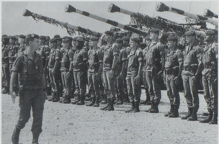
Im Rahmen von UNO- und Nato-Mandaten stehen heute Einheiten der Fremdenlegion unter anderem in Ex-Jugoslawien im Einsatz.

Kommt der sprichwörtliche Traditionalismus der Franzosen