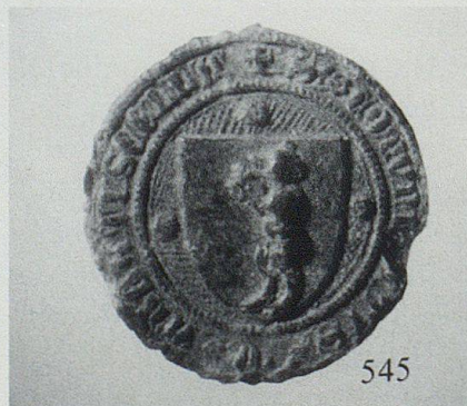
Das älteste Siegel des Landes Appenzell hängt an den im Bayerischen Hauptstaatsarchiv in München aufbewahrten Städtebundsurkunden vom 4. Juli 1379 und trägt die Umschrift S(IGILLUM) COMUNITATIS IN ABBATISCELLA.

St. Gallen war kein Einzel- oder gar Sonderfall, es folgte einer überregionalen Entwicklung. Im Laufe des Hoch- und Spätmittelalters konnten sich viele Städte gegenüber ihren Herren weit gehend verselbständigen. Die Städte wuchsen und gewannen an Bedeutung als wirtschaftliche Zentren. Die «Städtelandschaft» der Bodenseeregion hatte sich während des 11. und 12. Jahrhunderts prägend herausgebildet: Zu den «alten» Städten Konstanz, St. Gallen, Lindau, Stein am Rhein und