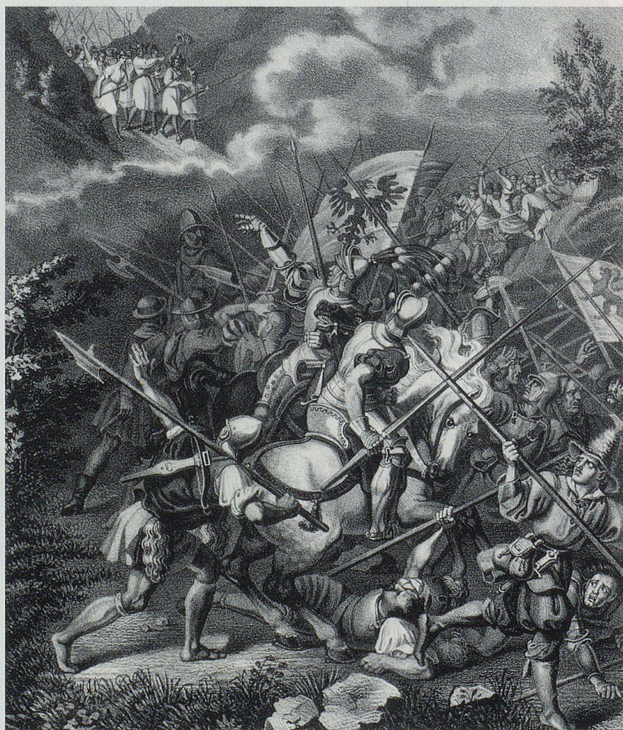
Darstellung der Schlacht am Stoss aus der Chronik von Benedikt Tschachtlan (zweite Hälfte 15. Jahrhundert).

Den Österreichern folgten die Eidgenossen. Die Ostschweiz