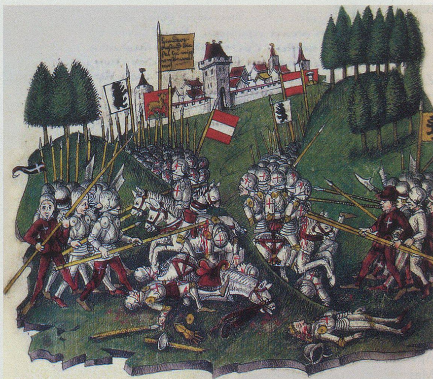
Darstellung der Schlacht am Stoss aus der Chronik von Benedikt Tschachtlan (zweite Hälfte 15. Jahrhundert).

Diese Sichtweise ist stark geprägt von der Nationalgeschichtsschreibung des 19. Jahrhunderts und zu wenig differenziert. Schon die Tatsache, dass rund hundert Jahre zwischen den Innerschweizer und den Appenzeller Kriegen liegen, lässt erahnen, dass die Umstände an-