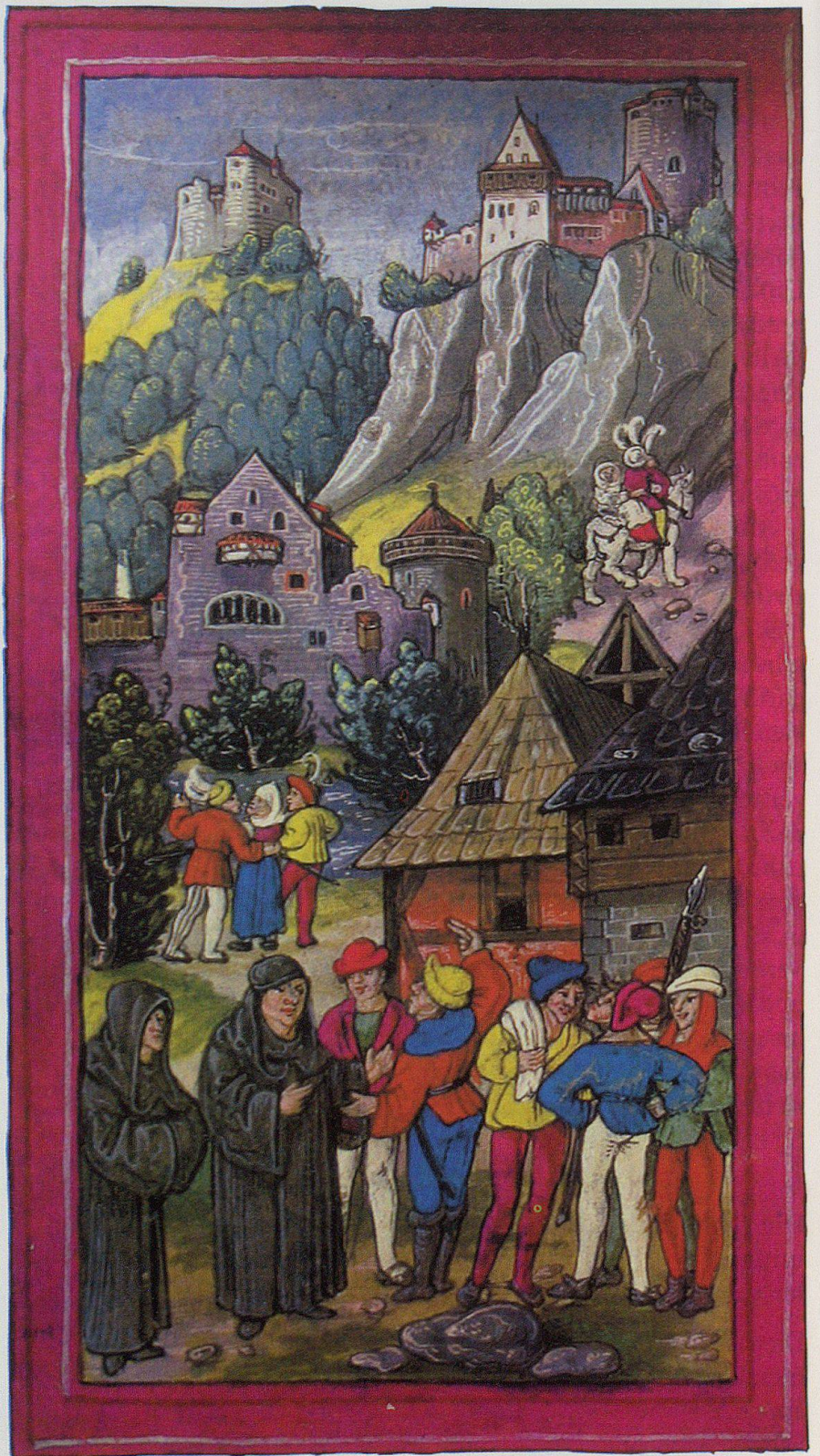
Appenzeller Bauern beklagen sich bei Mönchen des Klosters. Darstellung aus Diebold Schilling (zweite Hälfte 15. Jahrhundert).

Vor dem Hintergrund des Gesagten können folgende Schlüsse gezogen werden: Für die Zeit vor der Aufnahme in den Schwäbischen Bund sind kaum Spuren eines «Landes Appenzell» mit festen Organen der politischen und rechtlichen Verfassung zu erkennen. Hingegen scheint der Kontakt mit der Stadt St. Gallen, deren Verfassung sich seit der Mitte des 14. Jahrhunderts stark ausbildete, befruchtend gewesen zu sein. Via St. Gallen und Konstanz liefen auch die Kontakte zum Städtebund. Wie Konstanz für St. Gallen könnte St. Gallen für die appenzellische Land-