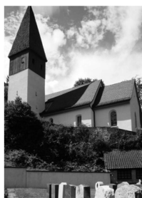
Das alte Kirch- lein von St. Mar- grethen.