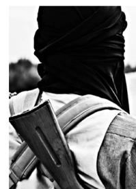
Der Bürgerkrieg in Syrien ging auch 2013 heftig weiter.