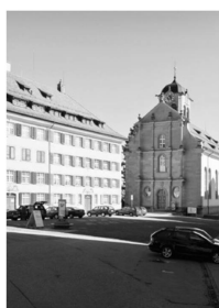
Der Lands- gemeindeplatz Trogen.