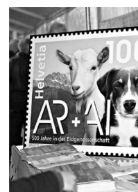
Die Sonder- briefmarke zum Jubiläum.