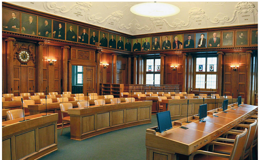
Kantonsratssaal im Regierungsgebäude.

rungsgebäude waren sicherlich die Feiern anlässlich der Wahl von Hans-Rudolf Merz zum Bundesrat 2003 und zum Bundespräsidenten 2008.