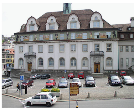
Regierungsgebäude und Obstmarkt heute.

Die Ausserrhoder Behörden nahmen ihre Arbeit im neuen Gebäude wenige Wochen vor Ausbruch des Ersten Weltkriegs auf. Während die ganze Welt eine turbulente Ära mit zwei Kriegen durchlebte, war es um das Regierungsgebäude in Herisau an sich relativ ruhig. Zu erwähnen ist die Visite General Guisans, der am 28. April 1940 zuerst der Landsgemeinde in Trogen und später Herisau die Ehre eines Besuchs erwies. Weitere wichtige Ereignisse in und um das Regie-