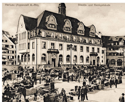
Das fertiggestellte Gebäude 1914 mit belebtem Obstmarkt.

Im Vergleich zu den Vorjahren war die Innerrhoder Landsgemeinde 2014 kurz, verregnet und unspektakulär. Der Grosse Rat hatte im Vorfeld alle Sachgeschäfte einstimmig zur Annahme empfohlen. SRG-Generaldirektor Roger de Weck, der dieses Jahr zu den Ehrengästen zählte, fand dies nicht weiter schlimm: «Es muss nicht immer Streit und Debatte sein. Das Wesentliche ist, dass man dank einer Landsgemeinde Demokratie sehen kann.»