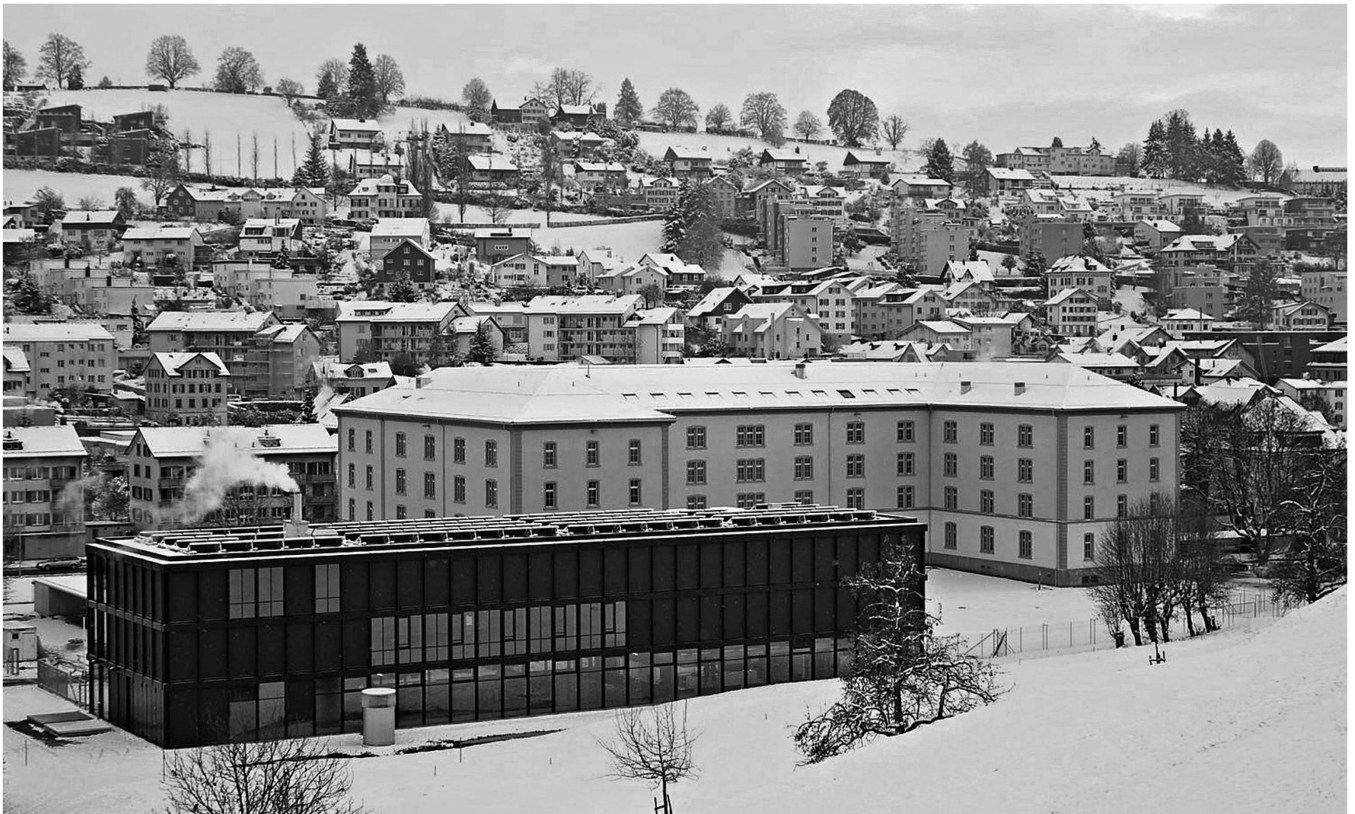
Die Kaserne Herisau erhielt ein neues Theorie- und Verpflegungsgebäude, das denkmalgeschützte Hauptgebäude im Hintergrund wurde umfassend saniert.

Strauss erzielte 121 Stimmen weniger. Sein Wohnsitz ausserhalb der Gemeinde wurde ihm zum Verhängnis.