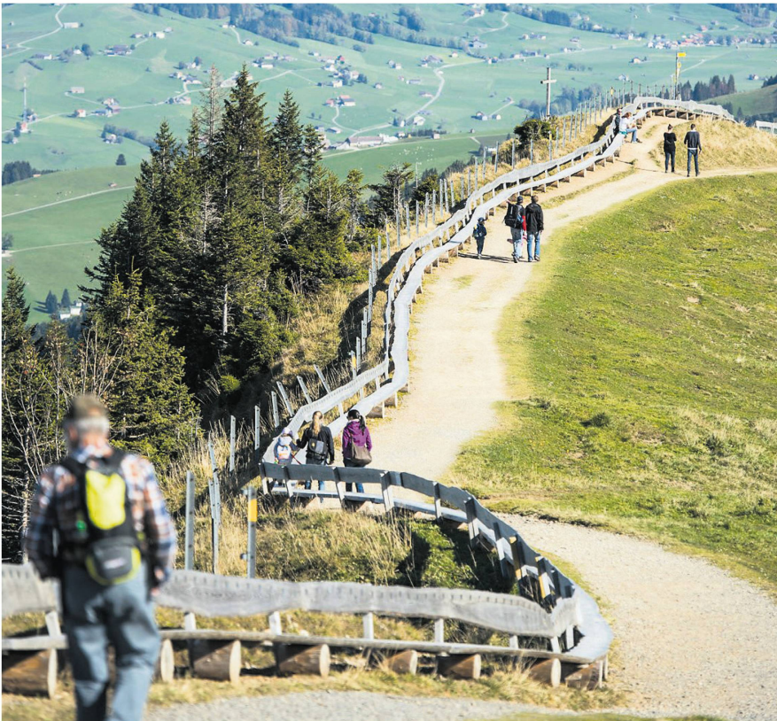
Die längste Bank der Welt auf dem Kronberg.