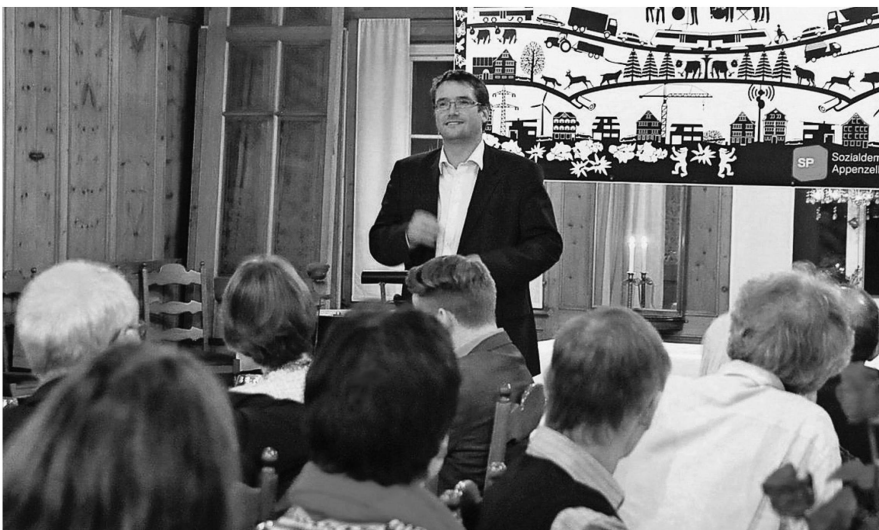
Christian Levrat, Präsident der SP Schweiz, war Ehrengast am Jubiläum der SP Appenzell Ausserrhoden.