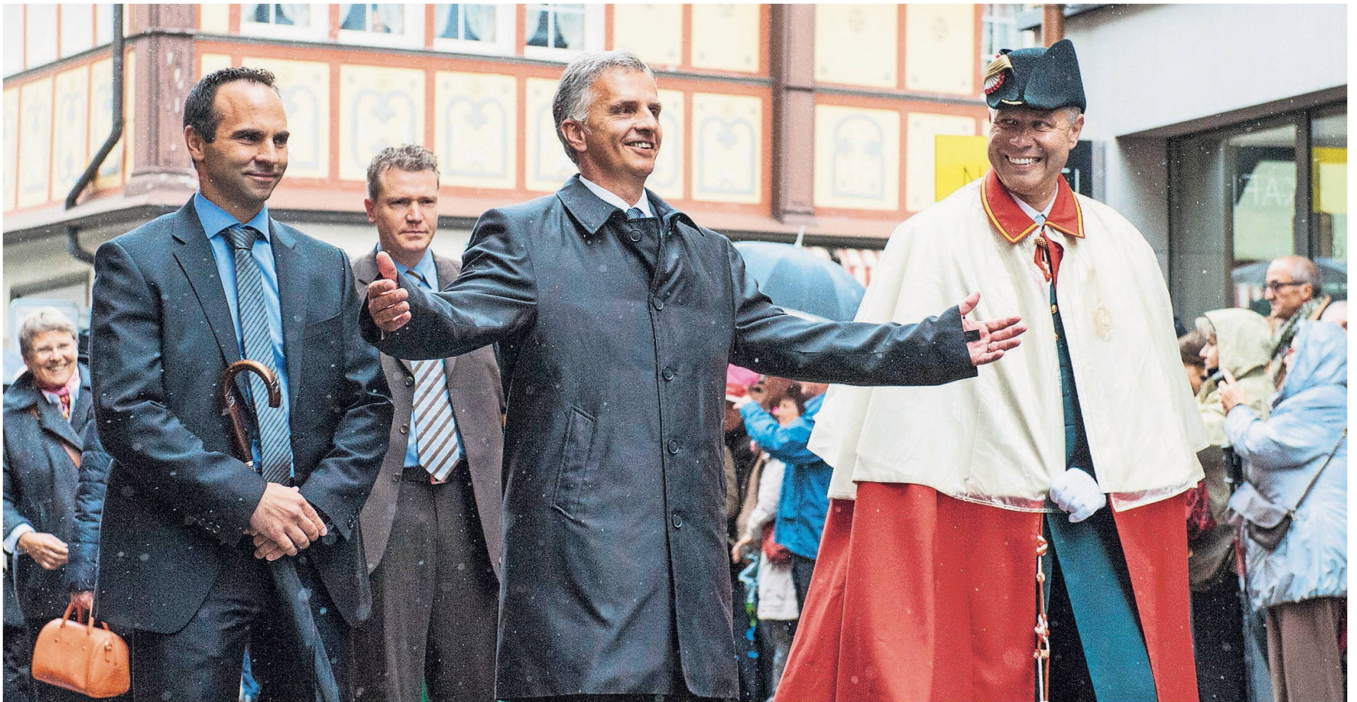
Bundesrat Didier Burkhalter führte die Liste der Ehrengäste der Innerrhoder Landsgemeinde an.

Von den Sachgeschäften gab nur der Kredit von 1,5 Millionen Franken für die Erstellung eines Gehwegs im Bezirk Schlatt-Haslen Anlass zu Diskussionen. Ein einziger Bürger kritisierte den unnötigen Verbrauch von Kulturland und forderte den Bau eines konventionellen Trottoirs. Die Landsgemeinde folgte jedoch der Argumentation der Standeskommission (Regierung) und genehmigte den Kredit mit grosser Mehrheit.