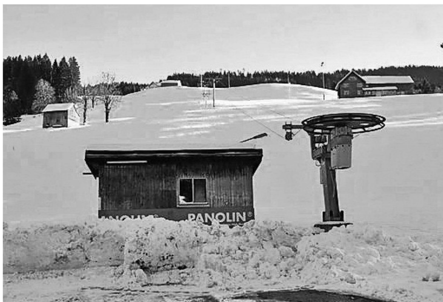
Am Skilift Bömmeli in Urnäsch wurden die Bügel im Winter abgehängt.