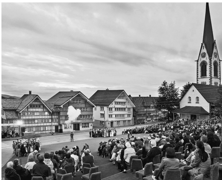
Das Festspiel «Der dreizehnte Ort» auf dem Landsgemeindeplatz in Hundwil besuchten fast 15 000 Gäste.