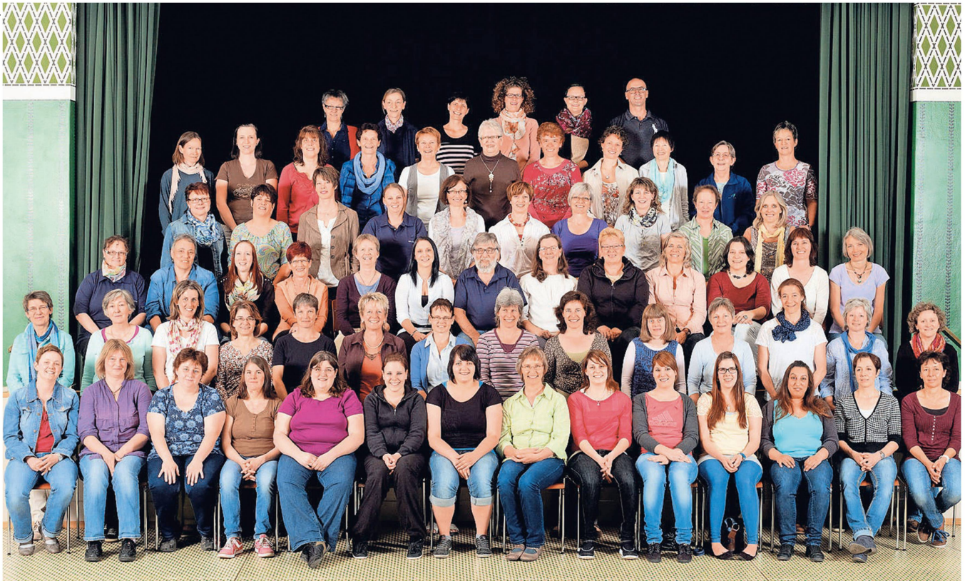
Mit neuem Arbeitgeber: Die Mitarbeitenden der neu gegründeten Spitex Appenzellerland.