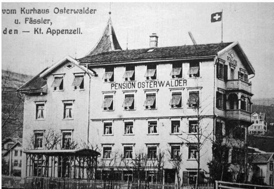
Verschwunden ist auch die ab 1930 von der legendären Naturheilerin Petronella d'Acierno alias «Pagliano-Tante» geführte Pension Osterwalder.

Trotzdem aber blieb und bleibt für Heiden der Tourismus wichtig, und bedeutende Meilensteine auf dem Weg in die diesbezügliche Zukunft waren in der jüngeren Vergangenheit der Neubau des Kursaals und des Hotels Heiden sowie die in mehreren Etappen erfolgte Modernisierung des Heilbades Unterrechstein. Überdies sind derzeit Erneuerungen im Bereich der Hotels «Park» und «Nord» geplant. Bereits im Entstehen begriffen ist das neue, verschiedene Lokalitäten und eine Tiefgarage aufweisende Panoramarestaurant «Fernsicht» an der Seallee, dessen Eröffnung im Jahre 2015 erfolgt.