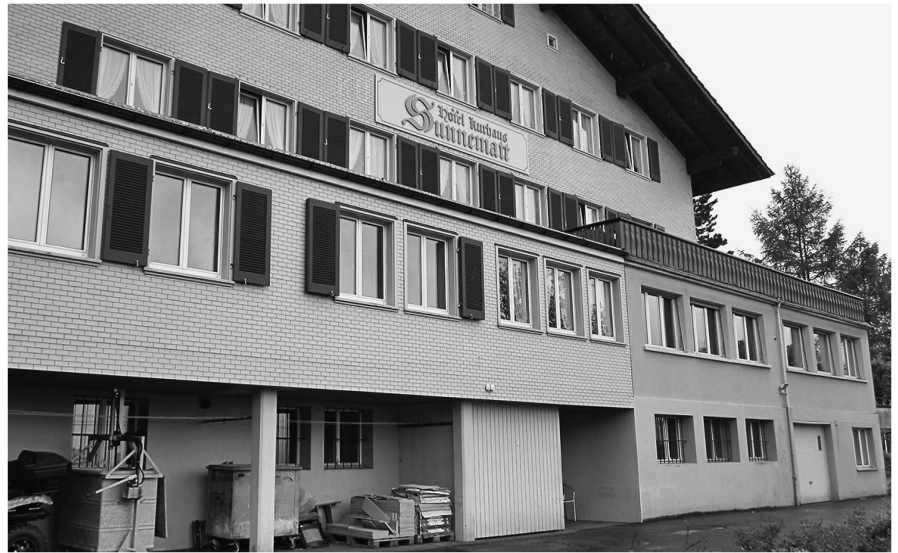
Bilder: Peter Eggenberger

In Heiden dominierten Kurgäste aus Deutschland, deren Anteil rund 75 Prozent ausmachte. Darunter befanden sich königliche, fürstliche und gräfliche Herrschaften, aber auch Gelehrte, Künstler, Schriftsteller und Angehörige des gehobenen Mittelstandes. Der Ausbruch des Ersten Weltkriegs führte zur panikartigen Abreise der Deutschen. Das jetzt einsetzende Hotelsterben fand in den Krisenjahren nach dem Krieg seine Fortsetzung. Als sich dann eine bescheidene Erholung einzustellen