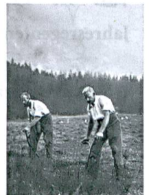
Die Kunst des Handmähens, S. 66