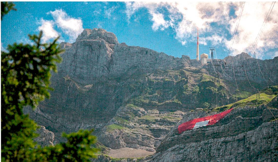
Nach einigen Tagen – je nach Wetter – wird die Fahne wieder eingerollt.

Steinschläge sicher gemacht werden. Erst nachdem der Fels geräumt war, konnte das Netz aus Seilen befestigt werden.