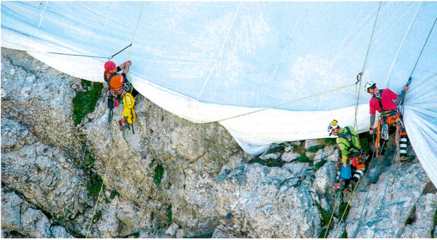
Meter für Meter rollen die Höhenarbeiter die Fahne aus.