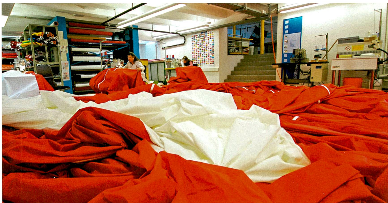
Die Näherinnen verarbeiteten über 4000 Laufmeter Stoffbahnen.

Am Sântis sind die Höhenarbeiter noch immer mit dem Ausrollen der Fahne beschäftigt. Zuständig dafür ist die Firma Höhenarbeit. Das Projekt Sântisfahne ist aufwendig. Die Vorbereitungen dauerten einen Monat. Der brüchige Fels musste gegen