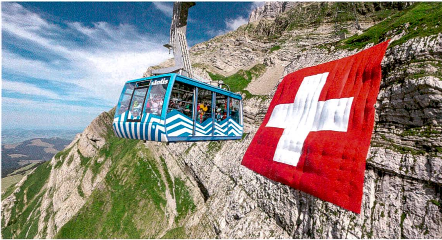
Majestätisch prangt die Fahne am 1. August an der Säntiswand.