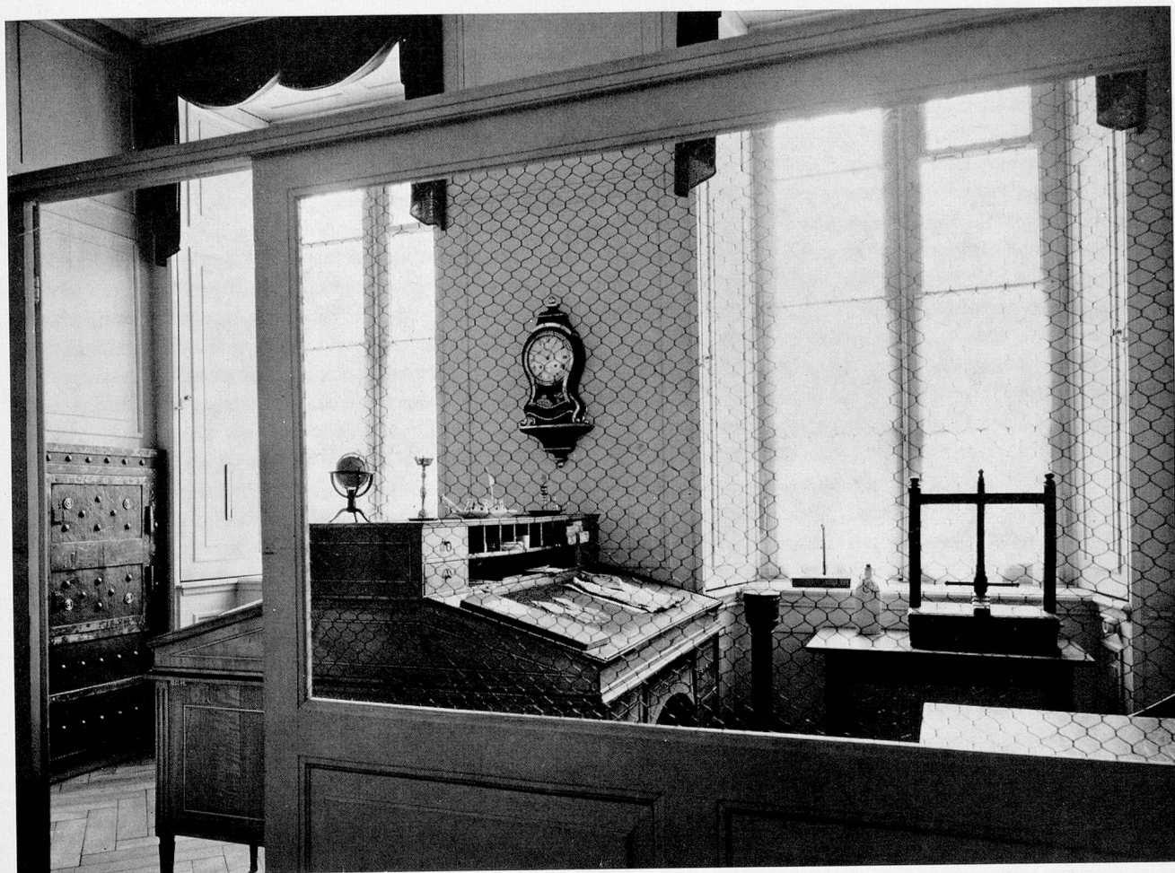
Kontor mit Abschränkung aus dem Basler Handelshaus zum Segerhof, dem Sitz der Firma Christoph Burckhardt & Co. (Historisches Museum Basel, Haus zum Kirschgarten)