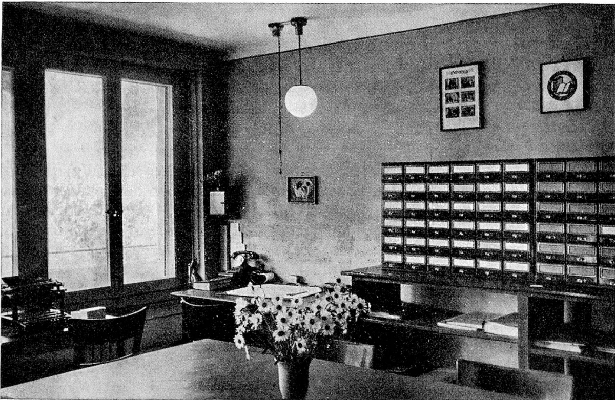
Der Zentralkatalog unserer 7 Kreisstellen in Bern

Bibliothekarbeit ist nie Selbstzweck, sondern sie bedeutet Dienen, und Bibliothekarbeit gedeiht nur bei hilfsbereiter Zusammenarbeit. Dienen und helfen: dies soll der Wahrspruch der Schweizerischen Volksbibliothek auch fürderhin sein.