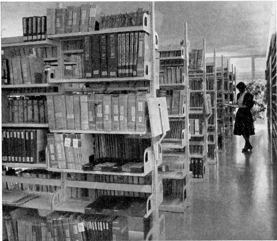
Neubau des Betriebswissenschaftlichen Instituts: Bibliothek-Anlage

Unsere Bode-Panzer-Bücherregale entsprechen den heutigen Anforderungen nach Leichtbau-Konstruktion. Sie erfüllen alle Voraussetzungen in statischer Hinsicht und geben der Einrichtung ein architektonisch ansprechendes Gesicht.