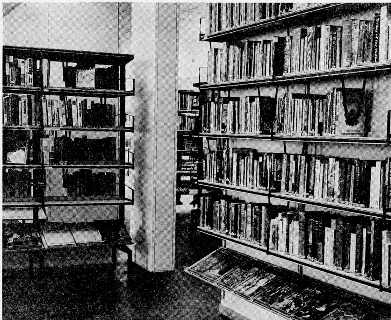
Stadtbibliothek Baden (AG)