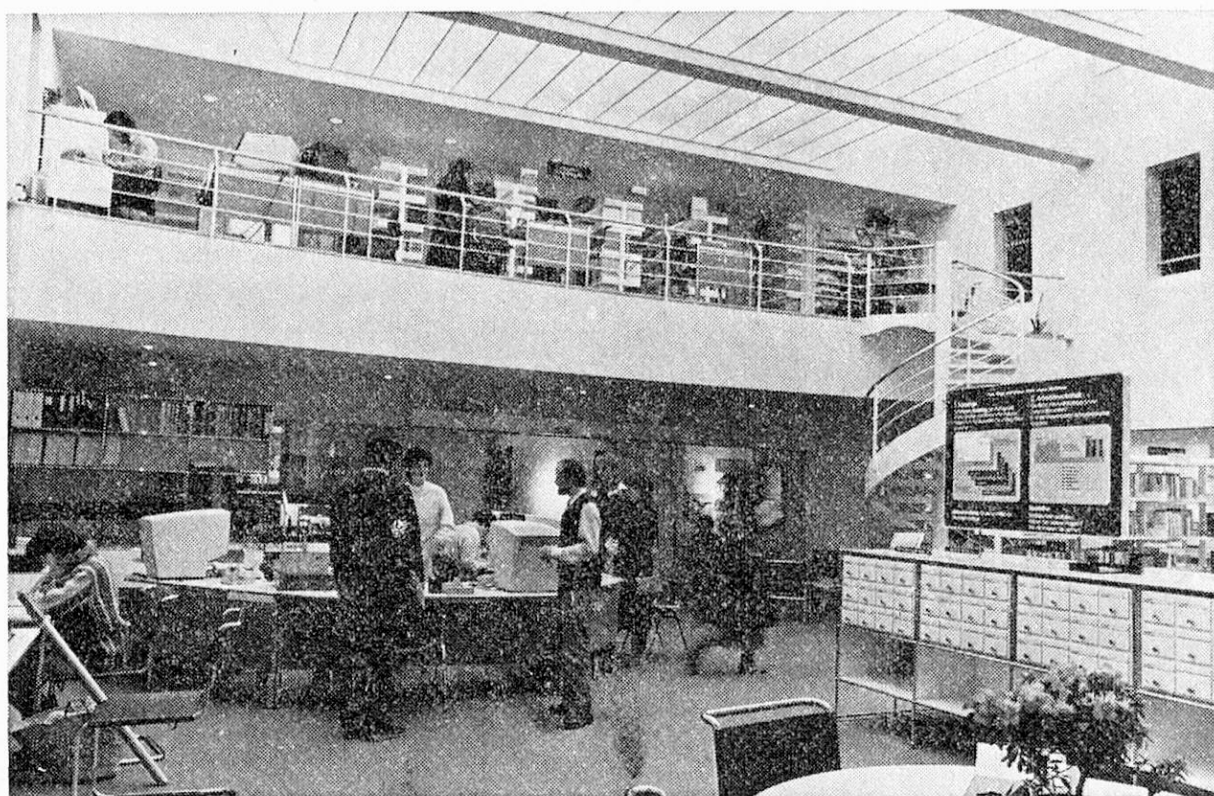
Die neuartige pädagogisch-didaktische Arbeitsmediothek — eine Informationsquelle und ein Arbeitsinstrument für den Lehrer.

Ausbau des Dachgeschosses sowie durch einen aareseitigen, dreigeschossigen Anbau war es möglich, die Bruttogeschoßfläche von 1880\text{ m}^2 auf 2800\text{ m}^2 zu vergrößern. Dies ermöglichte die saubere Zuordnung der vorgesehenen Betriebsfunktionen an bestimmte Gebäudegeschosse: