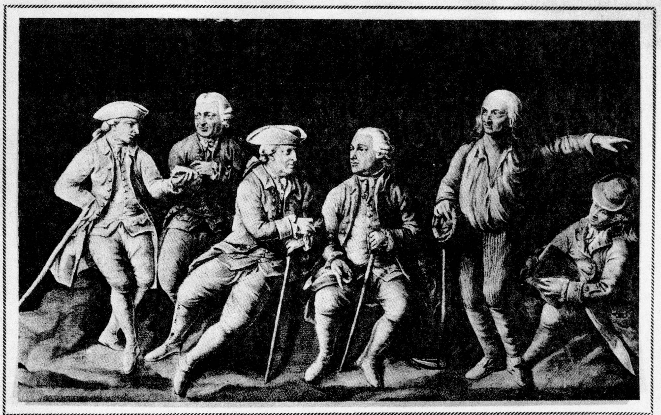
J. V. Sonnenschein sculps.

dem Katzenrütihof bei Rümlang. "Kleinjogg" ist einer der wenigen Zürcher Bauern, die mit Namen Eingang in die Geschichtsbücher gefunden haben. Schon zu seinen Lebzeiten galt er in Gebildetenkreisen halb Europas als populäre Figur. Daran trug hauptsächlich der Zürcher