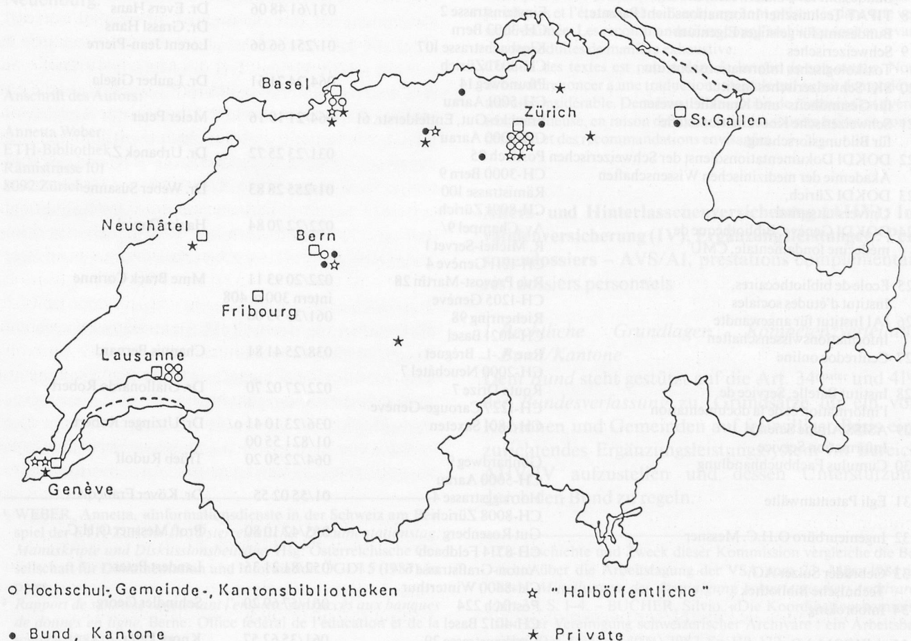
Standort der öffentlich zugänglichen Informationsdienste

Ausgehend von einer Liste von Institutionen bzw. Personen aus einer 1984 vom Bundesamt für Bildung und Wissenschaft durchgeführten Studie über die vorhandenen Online-Informationdienste 2 , konnten dank des «Schneeballeffektes» 35 Informationsstellen ausfindig gemacht werden. Dieses Vorgehen erlaubt gewiss keine lückenlose Zusammenstellung, und die Ergebnisse erheben somit keinen Anspruch auf Vollständigkeit. Bei fehlerhaften oder unvollständigen Angaben sowie bei nicht berücksichtigten Informationsdiensten bin ich für eine Mitteilung dankbar; dies könnte die periodische Veröffentlichung einer solchen Liste auf dem jeweils neusten Stand ermöglichen.