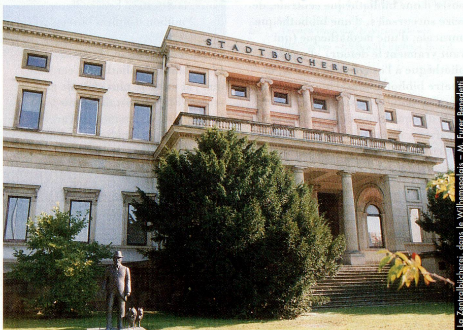
La Zentralbücherei, dans le Wilhelmspalais – M. Furer-Benedetti

D'une part parce que je rencontrais tous ces problèmes, d'autre part parce la prolifération d'informations ainsi que celle de ses supports nous contraint – nous, professionnels de l'information – à nous adapter sans cesse, à nous poser de nouvelles questions, à improviser même, je décidai d'aller voir ailleurs, soit en Allemagne. Je trouve extrêmement enrichissant et intéressant de comparer nos problèmes et notre évolution avec l'expérience acquise par d'autres tout en complétant ses connaissances linguistiques.