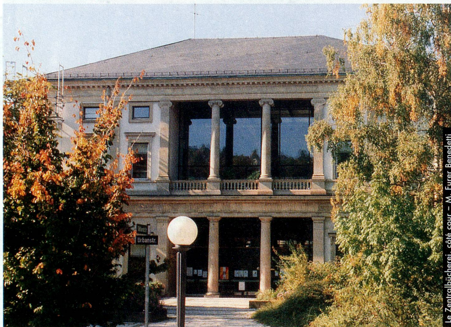
Le Zentralbücherei, côté cour - M. Furer Benedetti

Autre difficulté: pour être engagée par l'Office de la culture de la ville de Stuttgart, les copies seules de mes diplômes ne suffisaient pas, il fallait